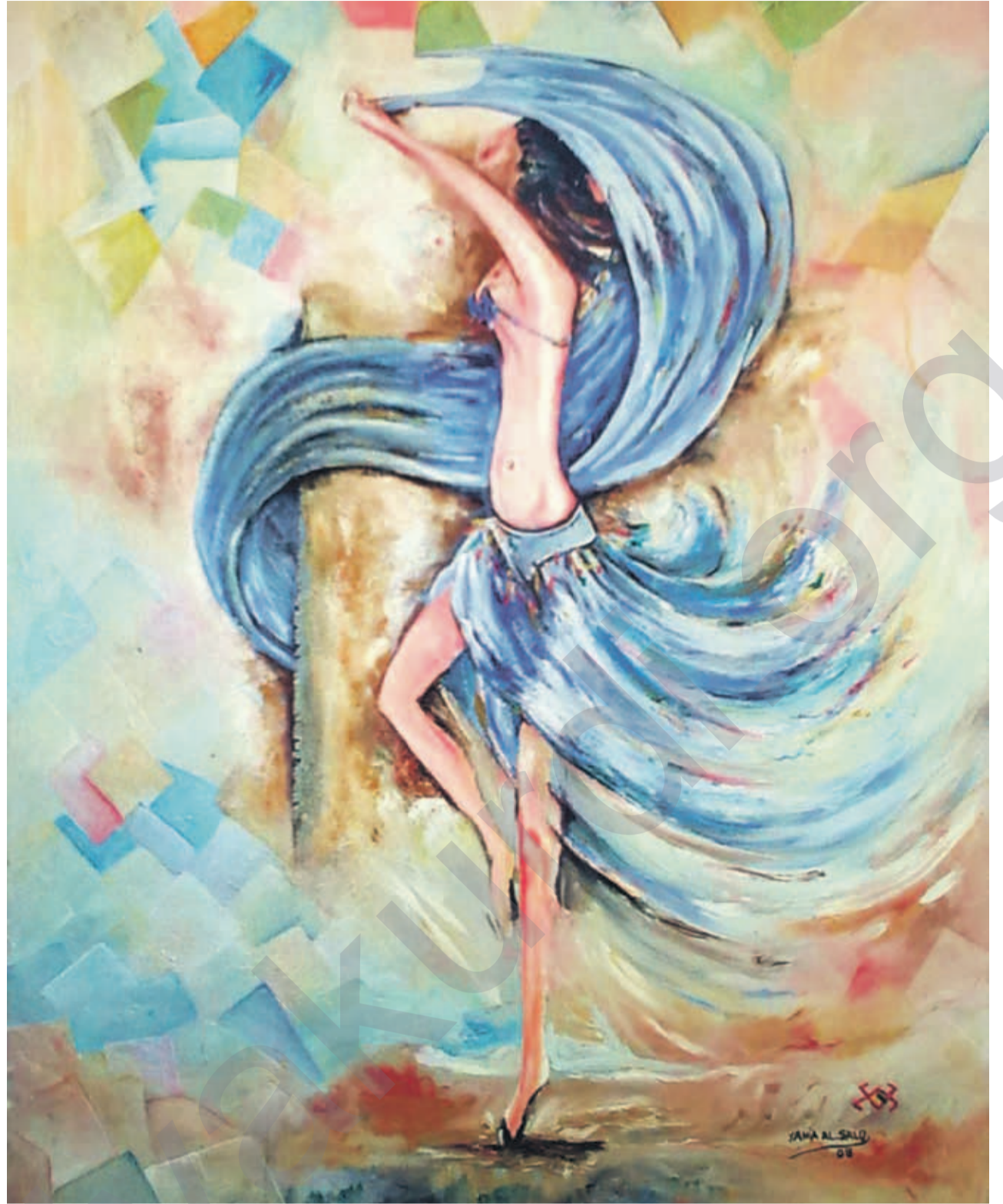
YEHYA AL SELO: Dansa rojilatê , 100 x 80 cm, boyaxa rûnî li ser tûwalê