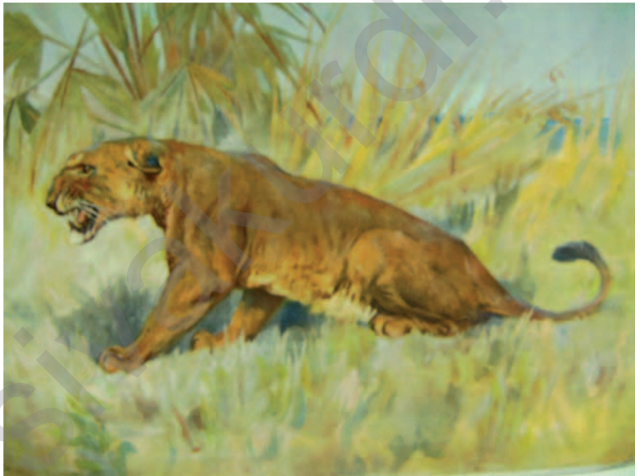
YEHYA AL SELO: Dêleşêr , boyaxa rûnî li ser tûwalê, 100 x 100 cm

Bi carekê de, hukûmet biryarê dide ku mafên mirovan biparêze û hurmetê şanî bide, îşkenceyê bi dawî bîne û girtîgehên bike wek malên "camekan/şefa". Her weha sozê dide ku çareserîyan ji pîrsgirêka kurdî re peyda bike. Partîya HEPê, ku wê demê alîkarîya xwe dide hukûmeta koalîsyonê daku hukûmeta "rêveberîya awarte" ji holê rabe û dixwaze ku mafê perwerdeya bi zîmanê kurdî bê garantî kirin, pirtûk û rojname bi