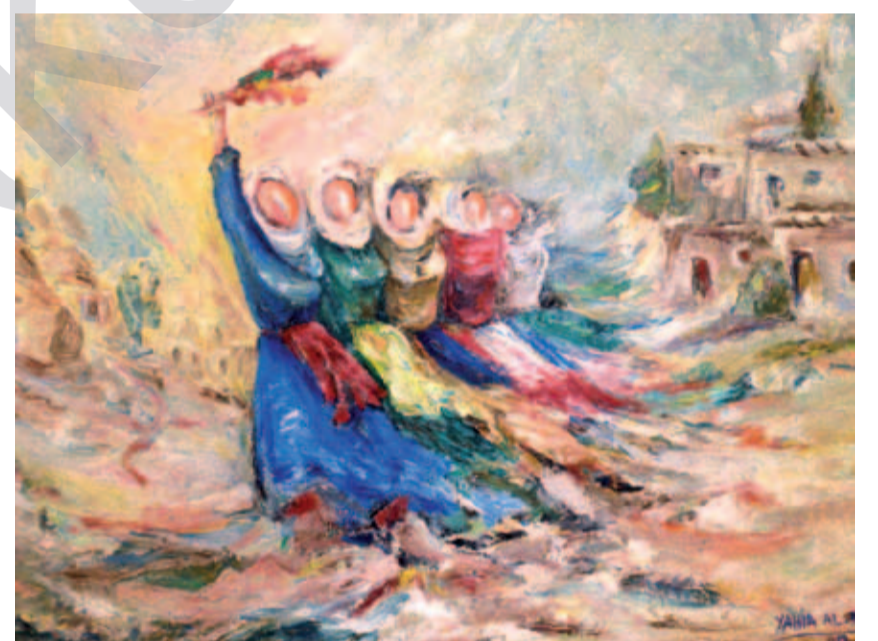
YEHYA AL SELO: Dilana kurdî , boyaxa rûnî li ser tûwalê, 60 x 40 cm