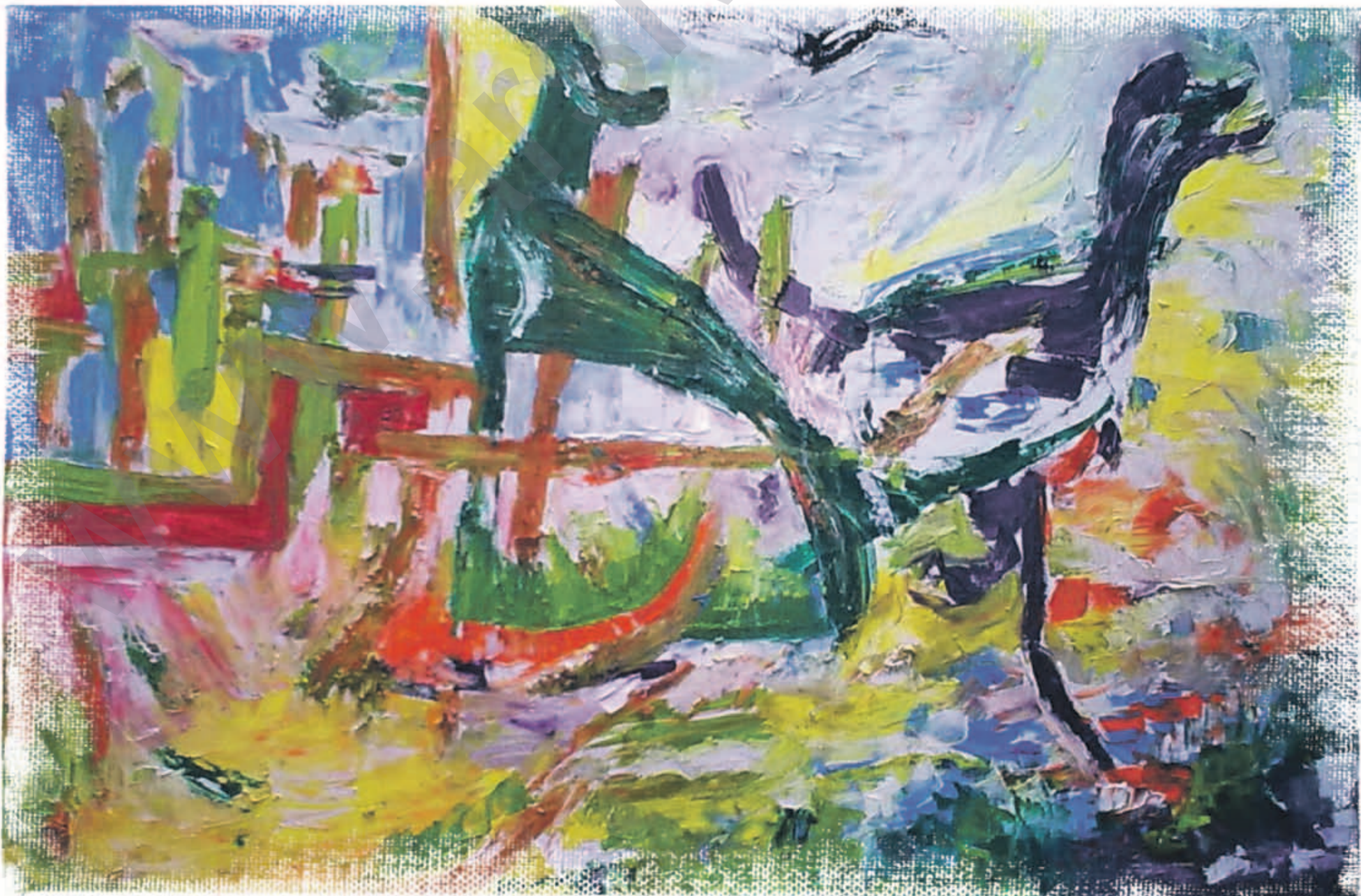
YEHYA AL SELO: Gunda, boyaxa rûnî li ser tûwalê, 120 x 90 cm

Heke hukûmeta Monti ya ku hatiye wezîfedar kirin ku li ser îtalîyan "fedakariyê" ferz bike, nexasim xistina ber lêpîrsînê ya qanûna kar