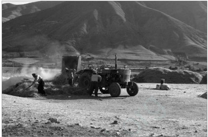
Bei der Grenzstadt Piranşar.

Als ich am nächsten Tag einen Öko-Aktivisten auf dem Busbahnhof von Urmíya treffen wollte, um an einige kritische