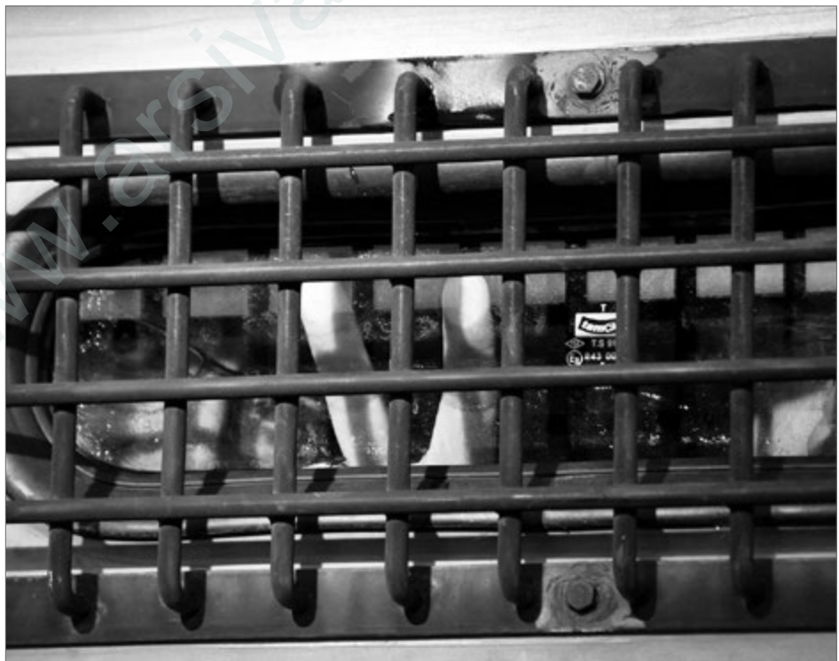
Die Festnahmen und Verhaftungen in der Türkei halten weiterhin an.

Eine andere Politik ist nur möglich, wenn die herrschenden Kräfte durch relevante Bewegungen zum Einbinden der Bevölkerung in demokratische Entscheidungsprozesse und zum Eingestehen von Menschenrechten und des Völkerrechts gedrängt werden – oder die Systeme selbst verändert werden, wie z. B. in Teilen Südamerikas, in Südafrika oder im Rahmen der Demokratischen Autonomie. Die destabilisierende Politik der BRD im Mittleren Osten und die deutsch-türkische strategische Partnerschaft haben Geschichte und sind heute nicht weniger menschenverachtend und gewissenlos als 1915. Friedens- und Demokratisierungsprozesse sowie gesellschaftliche Transformationen im Interesse der Bevölkerung können dagegen nur mit Respekt vor dynamischen Entwicklungen, im Dialog zwischen allen Beteiligten und in Anerkennung der Realitäten entstehen. ♦