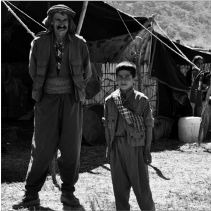
Auf der Hochalm