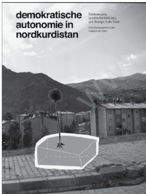
Kampagne TATORT Kurdistan c/o ISKU | Informationsstelle Kurdistan e.V. Spaldingstr. 130-136 20097 Hamburg

Jin, jîyan, azadî! Frauen, Leben, Freiheit!