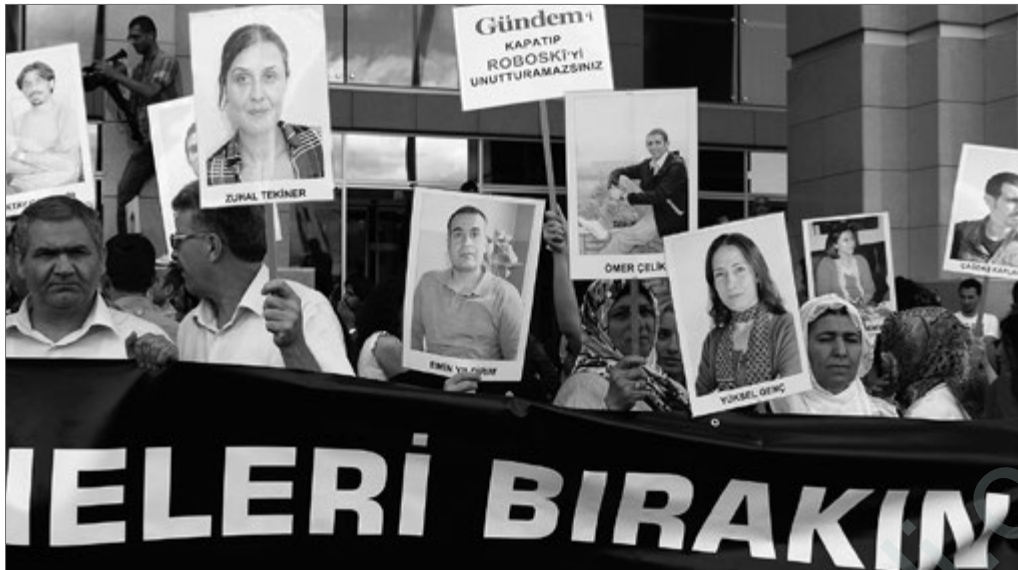
Vor dem Gerichtsgebäude demonstrierten viele Angehörige der angeklagten JournalistInnen für deren Freilassung.

widerfuhr, abbilden. Die frühe Kindheit haben die Kinder in Piran (Lice), einem Bezirk von Amed (Diyarbakır) mit 4000 Einwohnern, verbracht. Vor gut 20 Jahren haben türkische Soldaten den Ort zerstört und niedergebrannt. Die Familie flüchtete damals nach Istanbul, die Kinder sprachen anfangs nur kurdisch und wurden in der Schule von Lehrern und Mitschülern sowie auf der Straße von Passanten beschimpft und gedemütigt. Als Sohn einer armen Familie hat Ömer Çelik mit Mühe das Studium ermöglichen können.