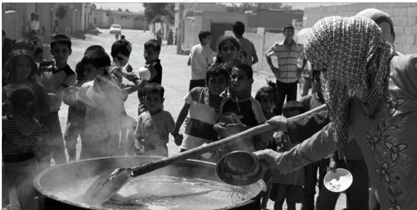
Suppenküche auf der Straße in Qamişlo