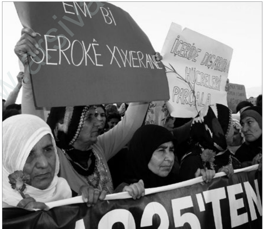
Protest in Izmir zum 9. Oktober. Am 9. Oktober 1998 verließ Abdullah Öcalan Syrien. Es begann eine Odyssee durch mehrere europäische Länder, in deren Verlauf er am 15. Februar 1999 festgenommen und in die Türkei verschleppt wurde.

Es ist kein Geheimnis, dass der einflussreichste imperialistische Staat, die USA, an Macht verliert. Dies zeigt sich in der Region. Im Moment scheinen die USA die Phase der Aufstände mit einer Restaurierung überstanden zu haben, allerdings haben sie große Verluste erlitten. Ihre Position ist bei der Gesellschaft in der Region offensichtlich. Anlässlich der Vorkommnisse wegen eines Films [ gemeint ist hier das Mohammed-Video ] konnten wir sehen, welche Dimension der Hass auf den Staat erreicht hat. Von dem Selbstbewusstsein der Bush-Phase («Wir können den Mittleren Osten mit unserer Militärmacht allein nach unseren Vorstellungen gestalten») ist man gezwungen zu einer Phase zu übergehen, in der man auf Kollaborateure angewiesen ist. Ohnehin ist die Wahl Obamas ein Ergebnis der Krise. Die US-Hegemonie verliert in politischer, militärischer, wirtschaftlicher und ethischer Hinsicht sowie in allen anderen Bereichen an Macht und wird mit neuen Gegnern sowie Aufständen konfrontiert. Mittlerweile akzeptieren auch die USA, dass sich ein Übergang von der alleinherrschenden hegemonialen US-Machtstellung zu einer Welt mit mehreren Machtzentren vollzogen hat. ♦