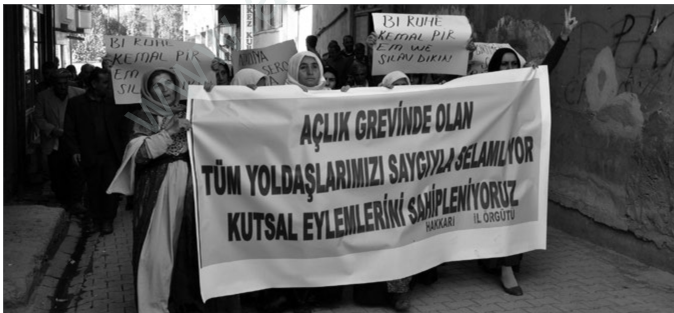
Der Hungerstreik in den Gefängnissen der Türkei, der am 12. September begonnen worden ist, weitet sich aus. Täglich schließen sich neue Gefangene an.

Damit meine ich die Beendigung der Gewalt und der Situation auf İmralı. Die Militärausgaben des Staates explodieren. Jeden Tag bombardiert das türkische Militär kurdische Gebiete und führt umfassende Militäroperationen durch. Zusätzlich hält die sogenannte KCK-Massenverhaftungswelle an. Diese Tatsachen müssen wir berücksichtigen und deswegen soll sich niemand Illusionen machen. Es gibt keine Gespräche. Gegenteilige Behauptungen aus AKP-Kreisen sind schlichtweg falsch. Damit hat die AKP lediglich kurzfristige, taktische Ziele verfolgt: Sie wollte ihren Parteikongress retten, denn die Behauptungen wurden kurz vorher gestreut. Und sie wollte die Kurden manipulieren. Sie wollte für Verwirrung sorgen, um den Widerstand der Guerilla und die Aufstände der Bevölkerung zu schwächen.