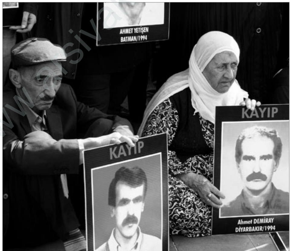
Die Angehörigen der »Verschwundenen« gehen weiter jede Woche auf die Straße und fordern Aufklärung über den Verbleib der Vermissten.

5 1000. Jahrestag des seldschukischen Sieges über die Byzantiner 1071 in der Schlacht von Manzikert (heute türk.: Malazgirt, kurd.: Kelê); dieser Sieg gilt als Beginn der seldschukischen, später osmanischen Herrschaft über das heutige Anatolien.