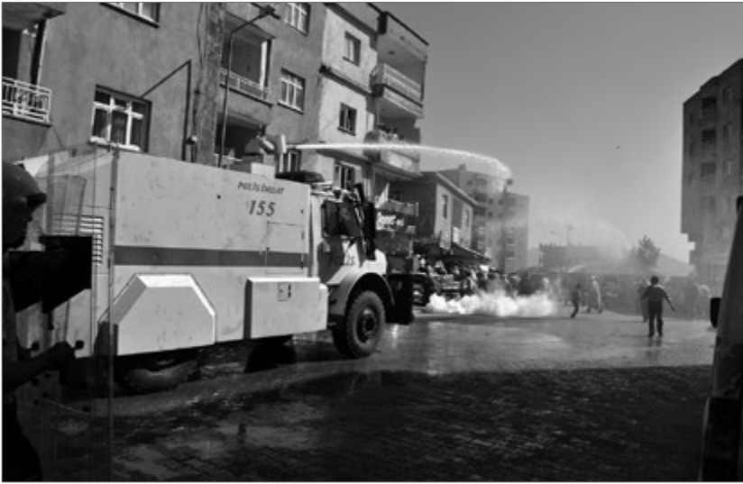
»Sicherheitskräfte« greifen Demonstration an.