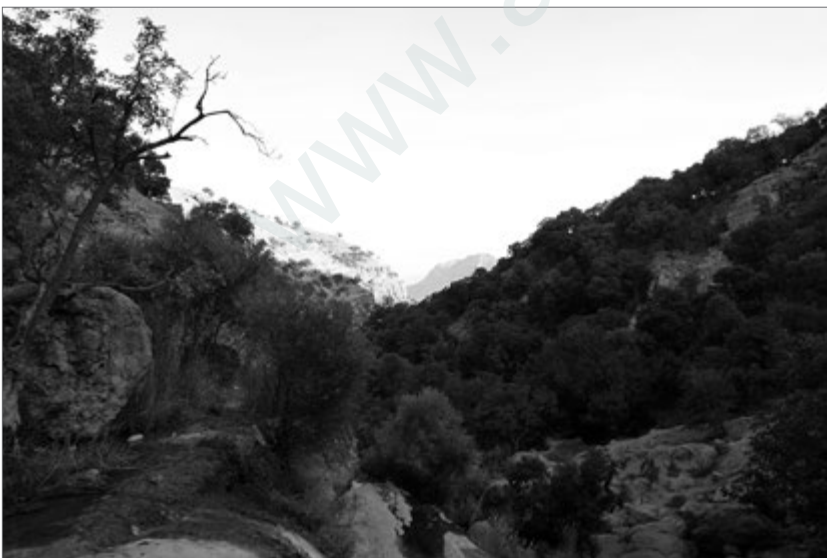
Die Berge von Luristan

Später erfuhr ich von FreundInnen, dass es in der Gegend um Meriwan und Serdeşt große Wälder geben soll. Ich fuhr jedoch weiter nach Kermansah, unterwegs wieder nur vereinzelte kleine Waldflächen. Die Landschaft ist wie um Mahabad, Piranşar und Sine (Sanandadsch) bergig mit kleinen Ebenen. Weite Ebenen wie um Amed (Diyarbakır), Riha (Urfa) oder Hewlêr (Arbil) gibt es in Ostkurdistan nicht.