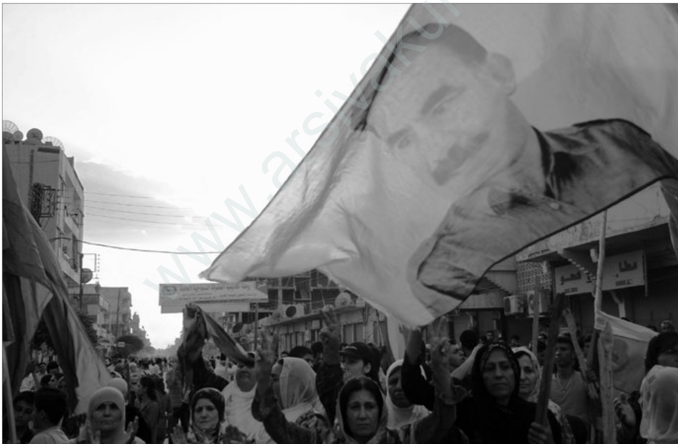
Demonstration in Westkurdistan

Alle Projekte und Beschlüsse, die in dieser Hinsicht von Frauen eingereicht wurden, sind auf der Generalversammlung des Volkskongresses angenommen und verabschiedet worden. Das ist ein großer Erfolg. Zum ersten Mal können wir in Westkurdistan unsere Arbeit auf dieser Ebene organisieren und durchführen. Das sind wichtige Garantien für die Selbstbestimmung, Teilnahme und Vertretung von Frauen im Prozess des gesellschaftlichen Neuaufbaus in Westkurdistan. ♦