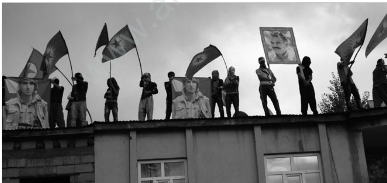
Trotz starker Repression ist die Bevölkerung in großer Zahl bei den Beerdigungen der getöteten Guerillamitglieder.