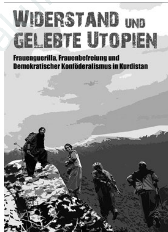
Widerstand und gelebte Utopien Frauenguerilla, Frauenbefreiung und Demokratischer Konföderalismus in Kurdistan (Mesopotamien Verlag) ISBN: 978-3-941012-61-5 Paperback, 592 S., 22,0 x 15,0 cm, 15 €

Das dritte Kapitel behandelt einen Ausschnitt aus der gemischten konföderalen Organisation der KCK (Gemeinschaft der Gesellschaften Kurdistans): den politischen Bereich, den gesellschaftlichen Bereich, das Komitee für Ökologie und das Volksverteidigungskomitee.