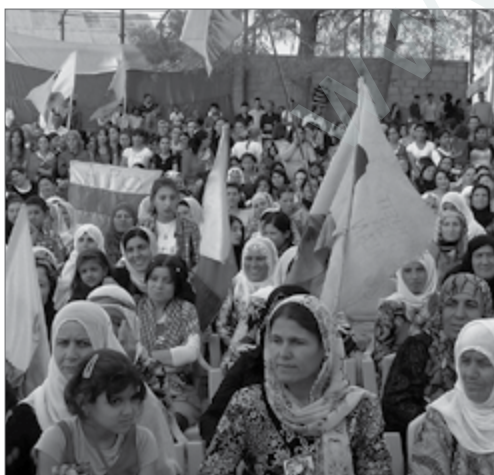
In Westkurdistan haben KurdInnen ihre Belange selbst in die Hand genommen. Im Rahmen der Demokratischen Autonomie organisieren sie ihren Alltag.