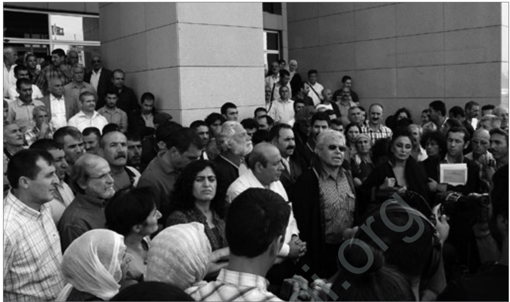
Nach Abbruch des Verfahrens am dritten Tag gaben die VerteidigerInnen eine kurze Pressekonferenz, mit dabei auch Abgeordnete der BDP.

Beim dritten Prozesstag hatte der vorsitzende Richter dafür gesorgt, dass Verwandte und andere Besucher nicht in den Saal kamen, weil einige von ihnen am Vortag im Saal applaudiert haben. Nur Presse war zugelassen. Der vorsitzende Richter wies die Anträge der Verteidiger durchweg ab. So seien die Angeklagten alle der türkischen Sprache mächtig, sie brauchten keinen Übersetzer, um der Verhandlung zu folgen. Abgelehnt wurde die Aufzeichnung auf Video. Ein Verteidiger erwiderte, dass das Gericht nicht anerkenne, dass der Prozess gegen die kurdische Presse gerichtet sei. Am selben Tag hätten 10 000 kurdische Gefangene in den Gefängnissen einen Hungerstreik