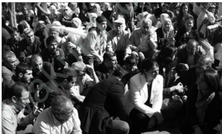
Angehörige der hungerstreikenden Gefangenen in Amed

Die Entwicklungen in Syrien und Westkurdistan (Syrisch-Kurdistan) beanspruchen weiterhin ihren Platz auf der politischen Agenda. Es sind 19 Monate vergangen, seit am 15. März 2011 die Aufstände gegen das syrische Regime begannen. Gegenwärtig hält die Gewalt in all ihrer Härte an und bringt menschliche Dramen mit sich. Zu Beginn der Ereignisse in Syrien verfielen türkische Repräsentanten in eine Erwartungshaltung, dass es auch hier zu einem raschen Regimewechsel wie im Vorfeld in Tunesien, Ägypten und Libyen kommen würde. Um keine Chance zu verpassen und der Macht näher zu sein, reagierten sie sehr früh. Sie haben die syrische Opposition in Istanbul versammelt, ihr ökonomische Unterstützung geleis-