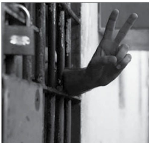
Seit dem 12. September befinden sich hunderte Gefangene in der Türkei in einem unbefristeten Hungerstreik. Täglich schließen sich dem Protest neue an.