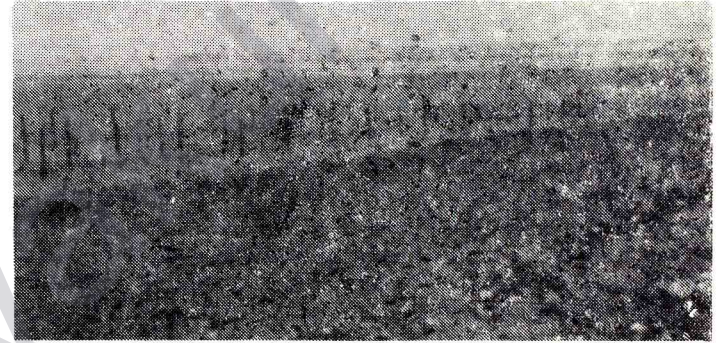
Halkımızın azim ve inancı önünde, ne oluşturulan mayın tarlaları, ne de vahşet uygulamaları dayanacaktır...

Kanalın duvarlarını sıvamak için kum ile çimentoyu karıştırıp harç yapıyorduk. Köylülerin çoğu kum yerine toprak kullanıyorlardı. Faşist komutan bu durumu görünce çok kızdı ve bağırıp çağırma, kum kullanmamız gerektiğini söylemeye başladı. Ama köylüler anlamamazlıktan geliyor ve "em Tirkî nizanin, fannakin" diyerek ona aldırış etmiyorlardı. Komutan öfkeden kudurmuş vaziyette, "bu kırolar