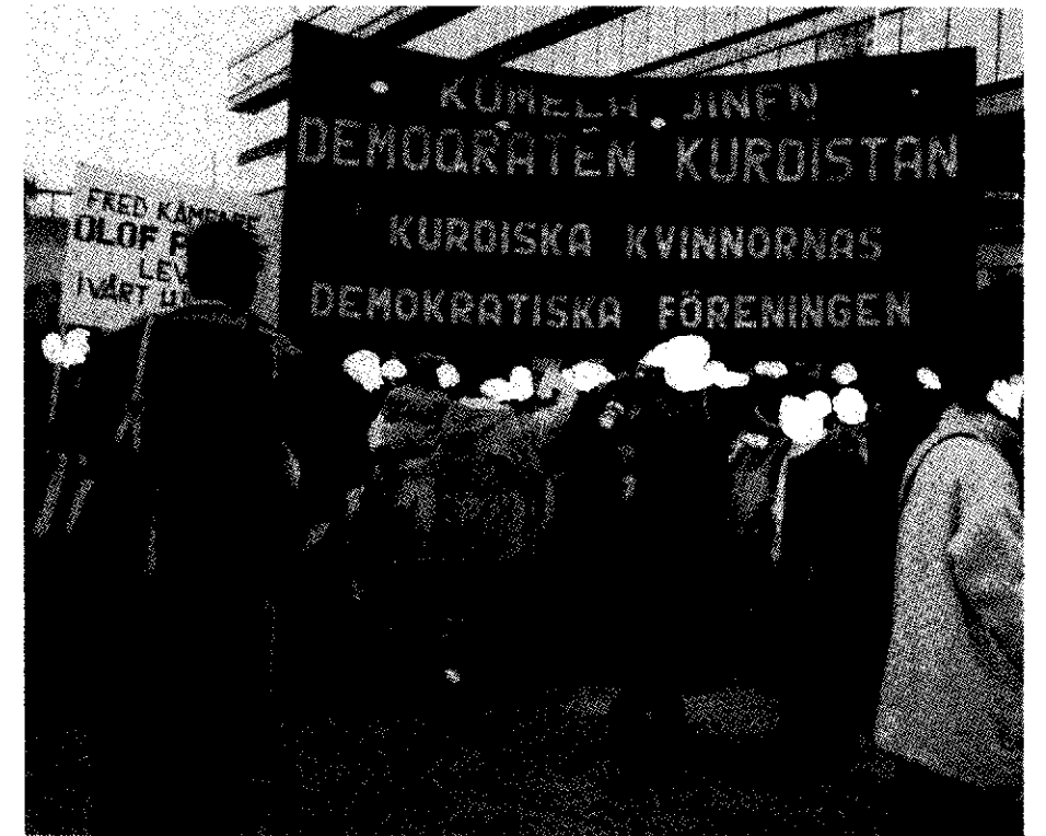
Di 8 ê Adarê Roja Jinan de, hemû rêxistinên jinên swêdiyan û yê n bîyanîyan yê n ku li Swêdê ne, roja xwe kirin roja "Bîranîna Olof Palme." Hemû rêxistinên jinan dûsa li meydana Sergels Torietê civiyan. Olof Palme bi bîr anîn. Komela Jinên Demokratên Kurdistanê jî beşdarê civînê bû. Televizyona Swêdê bi jîneke kurd re hevpeyvînek kir. Di fotografa jorîn de hun Komela jinên Kurd dibînin.