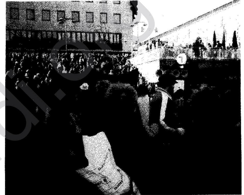
Di roja 8 ê Adarê 1986 — an de 10 federasyonên bîyanîyan li bajarê Stockholmê, li meydana Sergels Toriet, bixwenişandaneke gelek mezin Olof Palme bi bîr anîn. Federasyonê me jî di nav van deh federasyonan de bû. Di mîtînga "Bîranîna Olof Palme" de hejmara kurdan gelek bilind bûn.

Di merasima veşartina Palme de, serokwezîr, serok û berpirsiyarên gelek dewletan beşdar bûn. Li qeraxên rîya ku cenazê Palme tê de derbas dibû, qasî nîv milyonî mirov berhev bibûn. Federasyonê me jî, li Norra Bandoriet Flama û ala kurdî vekir.