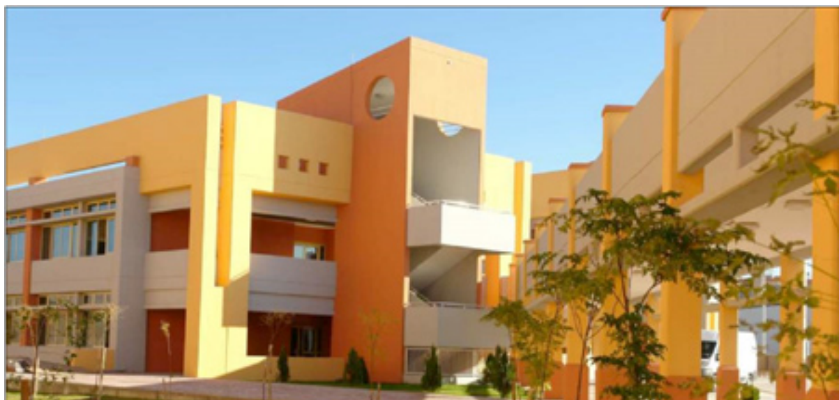
خویندنگای شوه‌یفات له هه‌ولێر

کادیره‌وه ده‌کریت، له‌باره‌ی بودجه‌که‌شیه‌وه وتی: «بۆمۆونه له بودجه‌ی ئەم‌سال، ٤ ملیار دینار بۆ زانکۆی رانیه دانراوه، که‌واته پرۆژه‌یه‌کی به‌رده‌وام ده‌بیت، به‌لام ئەو ٤ ملیاره بێنای یه‌ک به‌شه‌ ناو‌خۆ‌یی پێ دروست‌کرا‌یت چ جای بتوانیت پێدا‌ویستی زانستی و ئە‌کادیمی و تاقیگه بۆ زانکۆیه‌ک دا‌بنی‌ت، جگه له‌وه‌ش هه‌چ یه‌کێک له‌ بنچینه‌ زانستی و ئە‌کادیمیانه له‌به‌ر‌چاو نه‌گیراون و کردنه‌وه‌ی زانکۆکانیش ته‌نها بریارێکی ته‌واو سیاسیه‌ی له‌پێناو به‌ده‌سه‌لته‌نای زۆر‌ترین ده‌نگ بووه له هه‌لبژاردندا بۆ لایه‌نی ده‌سه‌لات».