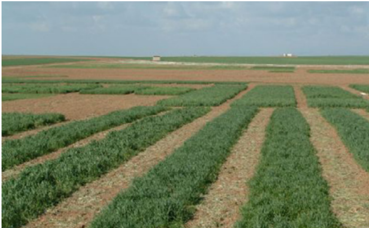
کشتوکال و ههموو کهرتهکانی تر له ههریمی کوردستان له پاشهکشهدان

پهرلهمانتاریکی فراکسیونی گوران پینستر بۆ روژنامه ئاماژهی پیکردبوو، بریکی زور کم لهو پرۆژه بودجهیه بۆ کهرتی کشتوکالی دهستنیشانکراوه.