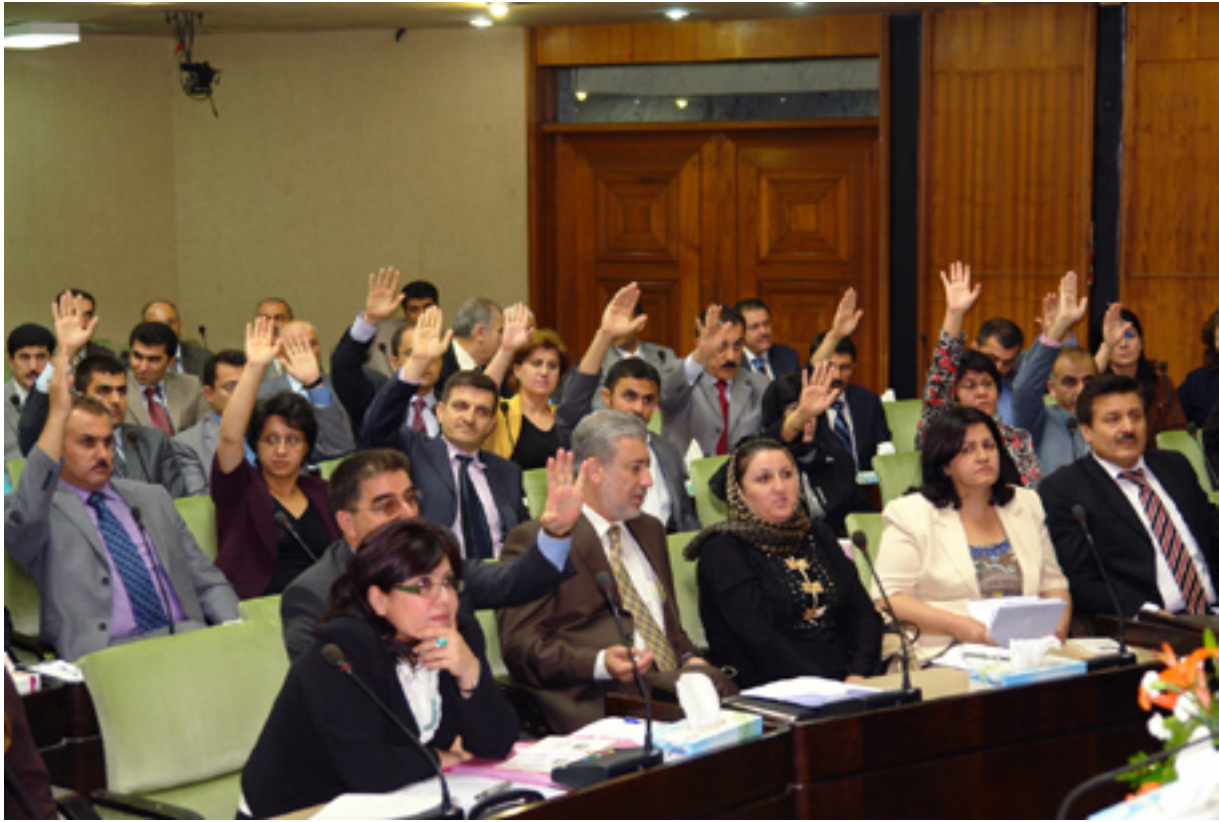
کۆبوونه‌وه‌یه‌کی په‌رله‌مانی کوردستان

به‌ه‌ی‌ز‌ک‌رد‌وه‌وه، که هه‌ردوو حیزبی ده‌سه‌لات چا‌وه‌پ‌وانی شه‌و شه‌نجامه‌و گۆرینی ته‌رازووی هیزه‌کان ده‌که‌ن، به‌وت‌ه‌ی حه‌مه‌سه‌ع‌ید حه‌مه‌عه‌لی، په‌رله‌مانتاره له لیژنه‌ی نه‌زاهه، د‌و‌ا‌خ‌س‌تی پ‌ی‌ش‌وه‌ختی دانیشته‌کانی په‌رله‌مان ده‌ر‌ب‌اره‌ی بودجه شه‌وه‌و د‌و‌پ‌ا‌ت‌ده‌ک‌ات‌وه، که ده‌سه‌لاتی سیاسی (یه‌ک‌یت‌ی و پار‌تی) چا‌وه‌روانی شه‌نجامی هه‌لب‌ژاردنه‌کانی په‌رله‌مانی ع‌ی‌راق ده‌که‌ن، هه‌ربۆیه تائینستا دانیشته‌کان ده‌ستیان پ‌ی‌نه‌ک‌رد‌وو‌ه‌ته‌وه له‌سه‌ر بودجه. له‌لایه‌کی دیکه‌وه، په‌رله‌مانی کوردستان له (2/12) دانیشتیکی کردنه‌وه‌ی خولی گ‌ر‌ی‌دانی دووهم له‌سالی یه‌که‌می خولی س‌ی‌یه‌می هه‌لب‌ژاردنی په‌رله‌مانی شه‌نجامدا له‌وتاری سه‌روکی په‌رله‌ماندا ئاماژه به‌وه‌ک‌را؛ به سه‌روکایه‌تی شاندیک له په‌رله‌مانتاران، سه‌ردانی ولاتی