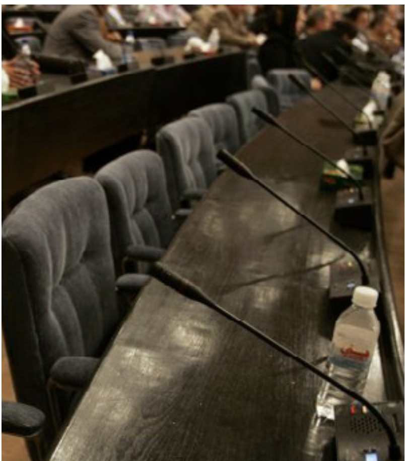
هۆلی کوبونه وه ی ئه نجومه نی نوینه رانی عیراق

هه لوه شانده وه ی په رله مان له ده ستووو دا له باری شکستی پیکه پانی حکومتا، وه ک ئه وه ی له هه ندیک له ده ولته تانی دیموکراسیدا هه یه، جۆریکه له گوشار بۆ سه ر سه رکرده سیاسییهکانی عیراق بۆ پیکه پانی حکومت و ریگه وتن له سه ر ئه و پرسه و هه یچ پۆستیکی بالای عیراقیش به بی ته وافوقی سیاسی ناتوانریت دابه شیکریت و هه ر پالیوراویکیش خوی بۆ پۆستیک بپالیویت، به بی ته وافوقی سیاسی له په رله ماندا ده نگ نا هینیت.»