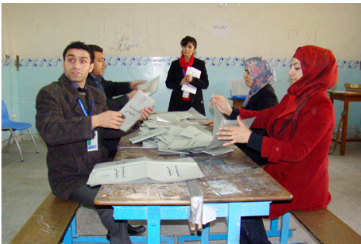
چهند کارمه‌ندێکی کۆمسیۆن له‌ کاتی جیاکردنه‌وه‌ی ده‌نگه‌کاندا

هاوکات عه‌لی ده‌باغ، وته‌یێژی حکومه‌تی عێراقیش رایگه‌یاندا: «حکومه‌ت