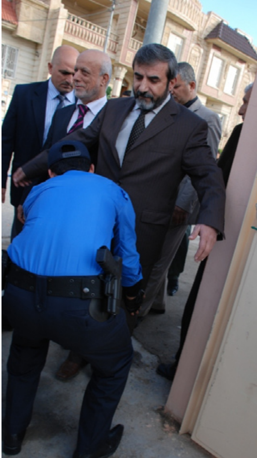
ئایا سەروکی حیزبەکانی تریش بەوشوئەیی دەپشکیرن؟

«کە خەلک لە کەرەقائی (۳/۷) دا، توانی ئیرادەیی چاکسازیو گۆرانکاری بەسەر دەسەلاتدا بسەپنێت و دەنگێکی زۆر بخاتە ناو خەرمانی ئۆپوزسیۆن و پشٹیوان و ھاوکاریکی سەر سەختی ھەرسێ بالەکی ئۆپوزسیۆن بێت، گۆران و کۆمەلو یەگرتو»، ئەمەش ئومیدیکی دیکە گەرۆی بەخشییەو بە رەوتی گۆرانکاریو کۆتایی پێنێن بە سیستەمی ناغەدالەتیو گەندەلیی لەم ھەرئەدا، کە بە خوینی کەسوکارمان ئازادکراو و خشتە خشتەمان بنیانداو.