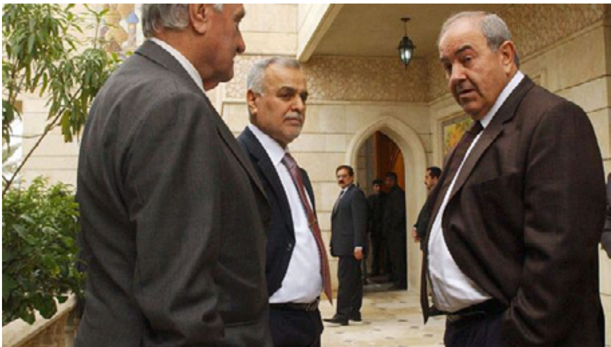
عهلاوی و هاشمی و پاچه چی چاوه پری ته نجامی ههلبژاردنه کان ده کهن

ئوهش دهکرت به مزوانه ئه و دوو لیسته بینه یه کولته ی په رله مانی، وتیشی: «ههردوو لیستی ئیئتلافی نیشتمانی و دهولتی یاسا زیاتر له لیستهکانی دیکه له رووی بهرنامه و سیاستی کارکردنه وه لیکه وه نزیکن، به پیچه وانه ی لیستی عیراقیه وه که چه ندین که سایه تی تیدایه تیبنیان له سه ره و برابان به دهستووو ماده ی (۱۴۰) نییه.»