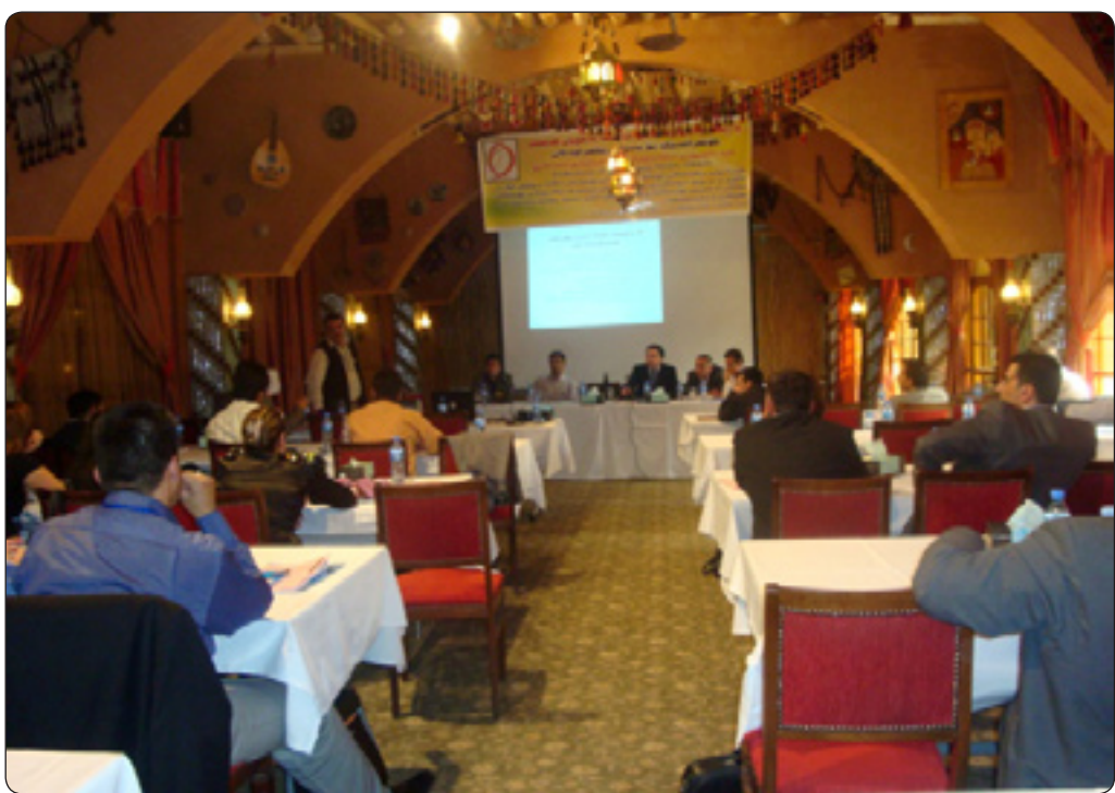
کۆفرانسی فیدراسیون، سه بارهت به پرۆژه یاسای ریکخراوه کانی کۆمه لگای مه دهنی - هه ولیر ۲۰۰۹/۴/۲۸

سه بارهت به وه ی چهند پرۆژه یهک له لایه ن چهند ریکخراویکه وه ناماده کراوه و رادهستی په رله مان و حکومهت کراون، به هه مان شیوه حکومه تیش پرۆژه یاسایهکی ئاماده کردوه تایبته به ریکخراوه نا حکومیه کانی ههریمی کوردستان به ریه بهری ئینستیتیوی کوردستان بۆ مافه کانی مرۆف وتی «نه وه نده ی من ئاکاداریم له سالی ۲۰۰۶ هوه