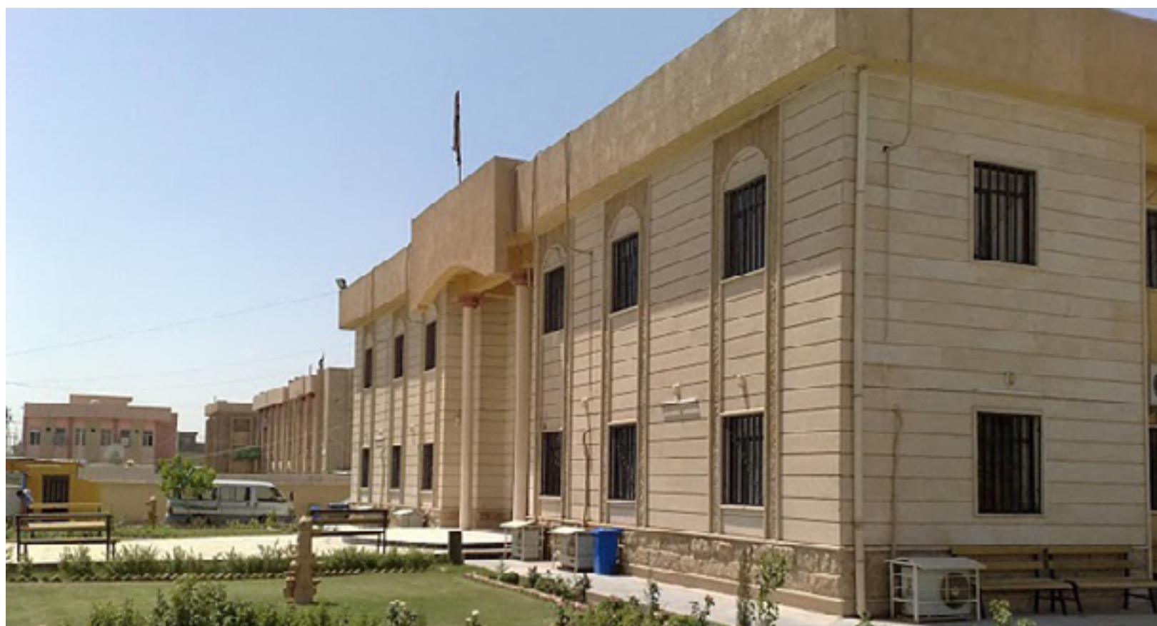
خویندکاره کورده‌کانی که‌رکوک ده‌گوازی‌نه‌وه بۆ تکریت و موسڵ

یه‌کنیک له‌و خویندکارانه ئاماره به‌وه ده‌کات «سه‌ره‌تای سالی که‌ ناومان له زانکۆکانی خسارووی که‌رکوک هاته‌وه، بریارماندا خویندکارانمان بکهن، دوا‌ی ئە‌وه‌ی خویندکارانه‌که‌مان ئه‌نجامداو به‌یاننامه‌یه‌کی نارازیبوونمان ده‌رکرد، سه‌رۆکی حکومه‌تی هه‌رێم که‌ هاته‌ که‌رکوک، به‌لینی پێدا‌ین، هه‌ر ئە‌مه‌سال کێشه‌که‌مان چاره‌سه‌ر بکات، به‌لام پێ‌چه‌وانه‌که‌ی ده‌رچوو، بۆ‌یه بریارێ دووباره خویندکارانمان داوه‌ته‌وه، ئە‌گه‌ر هه‌ر‌ه‌شه‌و توندوتیژیانمان به‌رامبه‌ر نه‌کهن».