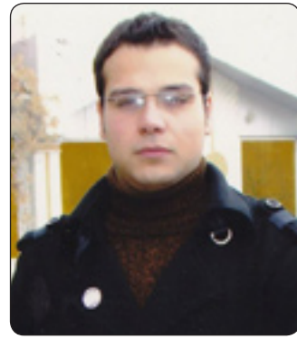
به ره پرسیاریتی یاسای و لایردنی سرؤوک

له برگه ی غی مادمده ی ۵۲ پرؤزه که دا هاتوه که په رله مان هه لده ستیت به گرتنه به ری ریوشوینی تومه تبارکردن له دژی سرؤکی هه ریم و جیگه که ی له سر به نامی شکاندنی سویندی ده ستوری و پیشیلکردنی مه ترسیداری ده ستور (انتهاک خگیر) یان خیانه تی گه وه. به هه مان شیوه له مادمده ی ۶۲ دا هاتوه که سرؤوک و جیگه که ی لاده بریت دوا ی بریاری دادگای ده ستوری له هه مان سئ حاله تی پیشوودا.