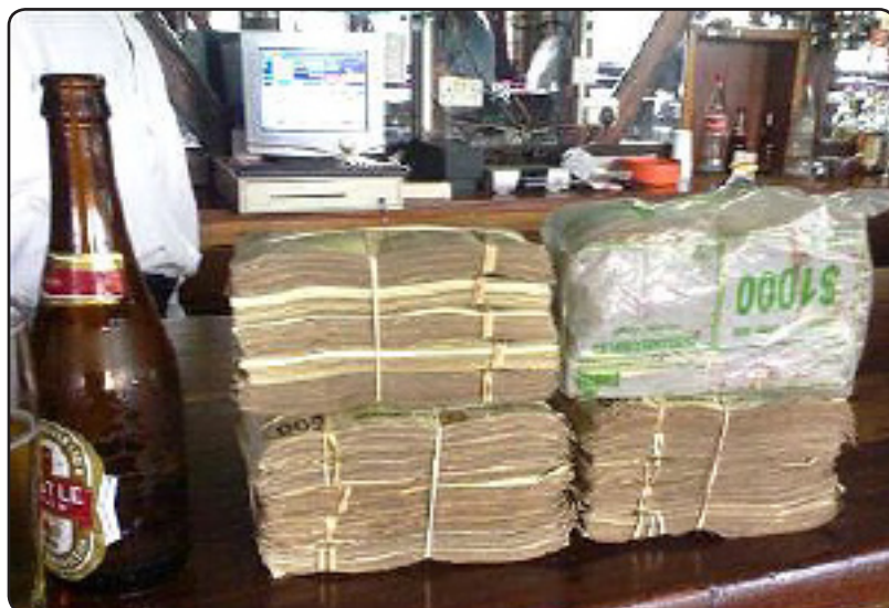
پاره ی یه ک بوتل بیره

سه ره کیترن هوکاری بی نرخبوونی دراو له هه ر ولاتیکی جیهاندا شهرو نه بوونی پلانیکی ئابوورییه، ئه وه تا ولاتیکی وه ک زیمبابوی هه رچه نده ناوی دراوه که شیان هه ر دۆلاره به لام به ها که ی له کیشه که ی که متره به جوړیک که ئه و کالایه ی به هوی ئه و دراوه وه ده کردریت کیشی که متره له کیشی کاغه زی دراوه که.