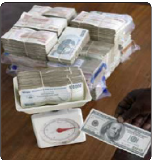
(۳) کیلو دۆلاری زیمابوی ده کاته (۱۰۰) دۆلاری ئه مریکی