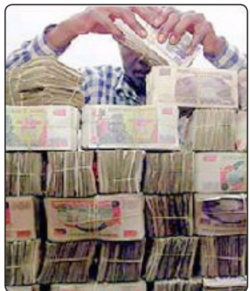
مووچه ی یه ک مانگی فه رمانبه ریک

وتیشی: «پیدانی پیشینه بۆ وه زیرو به ریوه به ره گشتییه کان و ئه فسه رانی پله ی عه میدو به ره و ژور بریتییه له (۱۰۰) ملیون دینار، بۆ