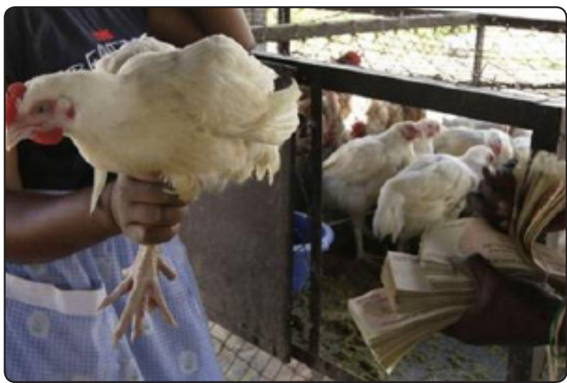
پاره ی یه ک مریشک

سه ره کیترن هوکاری بی نرخبوونی دراو له هه ر ولاتیکی جیهاندا شهرو نه بوونی پلانیکی ئابوورییه، ئه وه تا ولاتیکی وه ک زیمبابوی هه رچه نده ناوی دراوه که شیان هه ر دۆلاره به لام به ها که ی له کیشه که ی که متره به جوړیک که ئه و کالایه ی به هوی ئه و دراوه وه ده کردریت کیشی که متره له کیشی کاغه زی دراوه که.