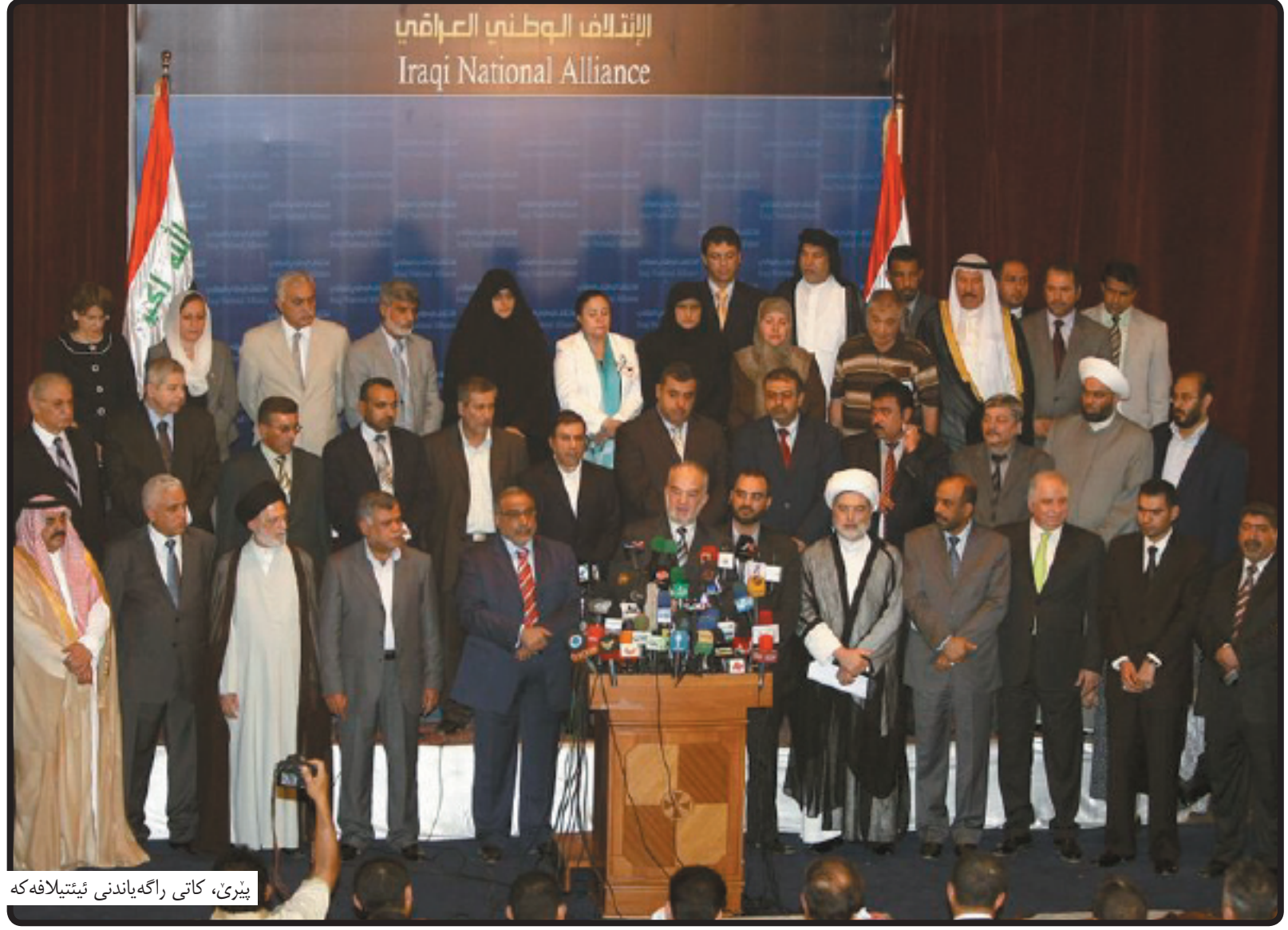
پێرئ، کاتی راگەیانندی نیشتمانییەئە