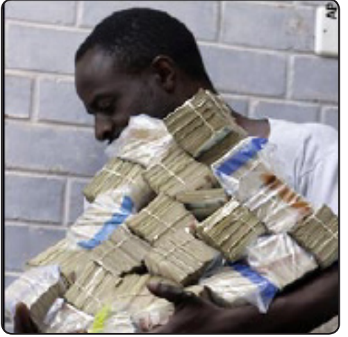
ده چیت بۆ بازار بو شت کرین

جگه له ئه مریکا. ئوسترالیا، بریادوس، بهامی، برمودی، بورونی، که نه دا، کاریبی، فیجی، کویانی، هۆنکۆنگه، جامایکا، لایبیریا، نامیبیا، نیوزیله ند، سه نگاهوره دوورگه کانی سلیمان، سورینام، تیاوانی نوی ترینیاد، توباکو، زیمبابوی، جامایکا. ئه و ولاتانه، که دۆلار دراوی فه رمییه انه.