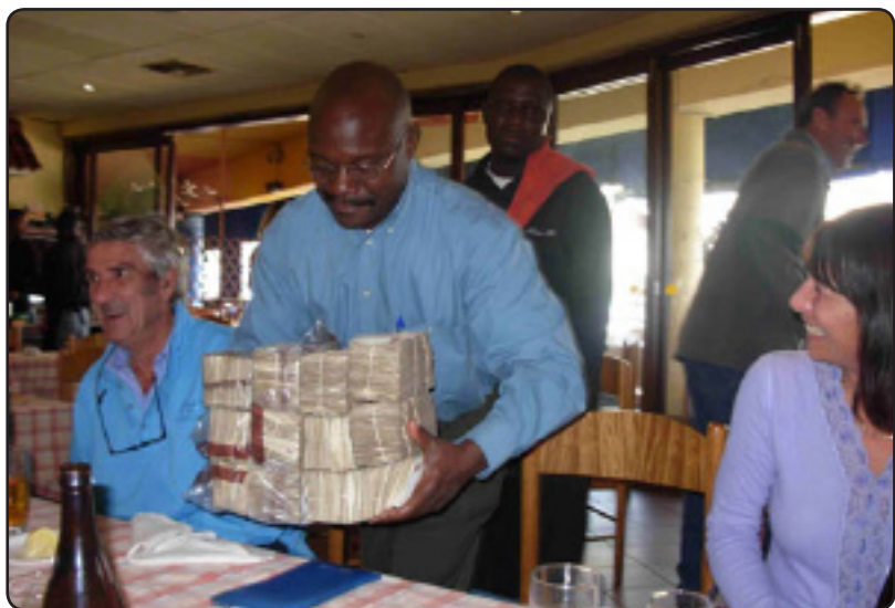
پاره ی یه ک ژه م نانخواردن