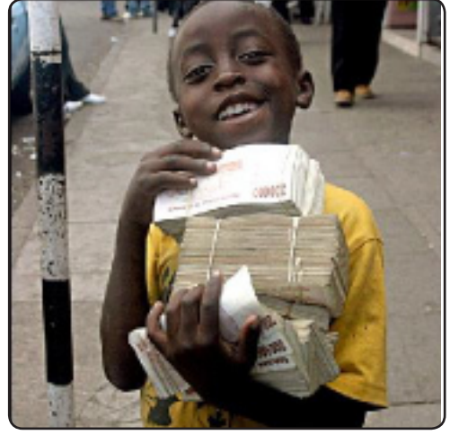
روژانه ی یه ک مندا ل