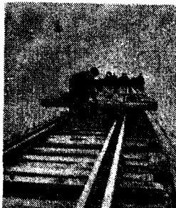
Rêhesinên Ewropayê di vî şerî de- xesarine zehf mezin dîtine; bi hezaran kilomêtr rêhesin bi bombeyên balafiran û bi dinamîto hatine xira kirin; îro ko şer qediyaye û rahetî vedigere Cihanê devûletan dest bi selihandina rêhesinên xwe kirine; wêneya jorin xebateke wilo pêş me dike.