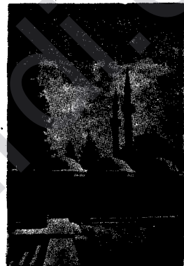
Şam bajarekî zehf şîrin e; em kur- dibêjin Şam şekir e, û bitenê welat jê şîrîntir e; ji bergehên Şamê, ên delat camîgehê.