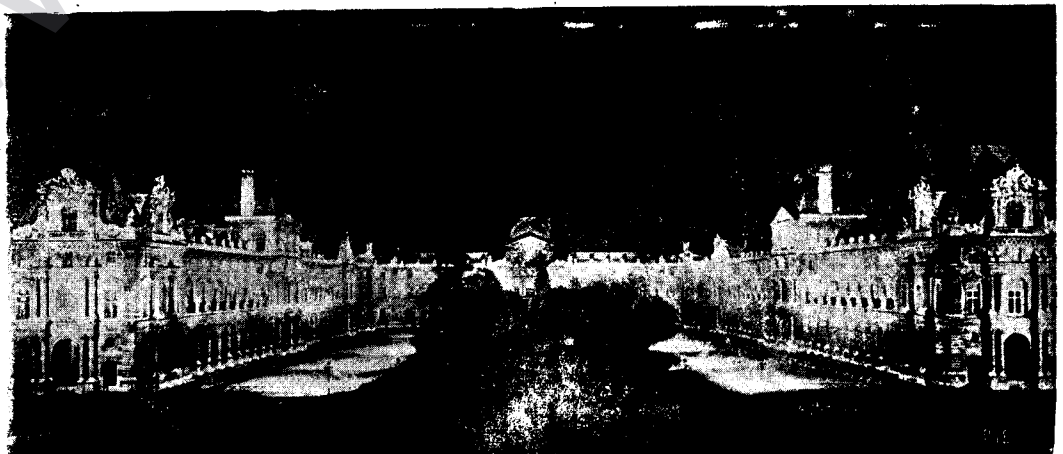
Mirovên pêyveki, mîletên bervehatî ji xwe re bajar û şaristanine çeleng û spehî, fireh û dilruba ava dikin, riyên van bajarên esfêltîrî ne; di van şaristanan de, xwendegah û zanisteyîne mezin hene; bajarên wîlo bi xestexane, bi îbadetgeh in; tede hotelên qenc, xwarinxaneyên baş hene; dora şaristanan tîr destgeh û febrîqa ne; ev şaristanekî wîlo.