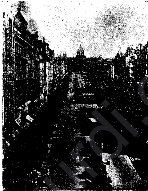
Şarîstanê Ewropayê mirêkên pêşveçûna wê erdê ne.