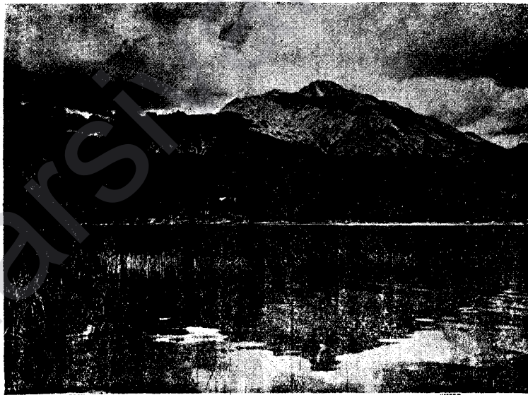
Kurdek wê bibêje ew e gola Wanê û çiyayê me'ê bilind û miqedes Ararat; payedariya azadî û serbestiya Kurdistanê.