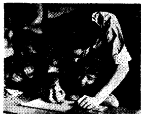
Zaroyan divê berî her tiştî, hîmî xwendînan û nivîsandînan zimane xwe bînin.