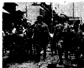
Serbendên çînî yê Ordîya yekemîn ketîne bajarê Rangûn: xelk bi şabûnî bi wan re dîmeşî.