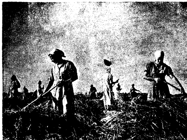
Keçebaw sooyetî bi palayîgê mijûl in.