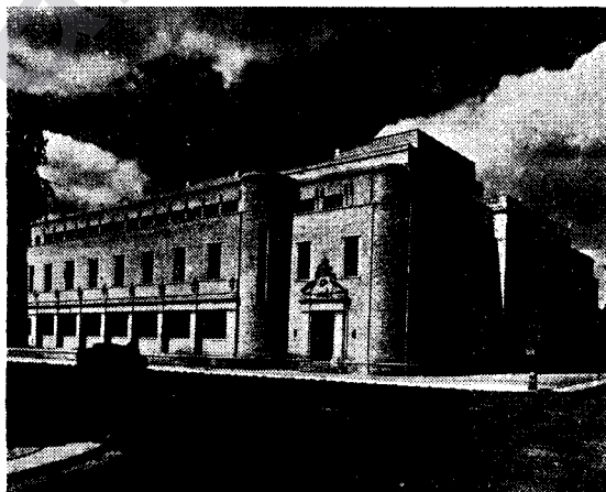
Xwendegah û zanîngeh ev in du stûnên miletekî ê xurtî û qaim. Bergeheke Çetengî ji ya Zanîngeha Oksfordê.

Awahî û îbadetgehên ko di wê awayî de ne, ji texlîtê gotîk in. Awayê gotîkî ji îl-de-Fransê derketîye, angî ji axa Frensê. Di sedsala 12 û heta 16-an de awahîyên gotîk gelek rewnaq da bûn Eurîpayê.