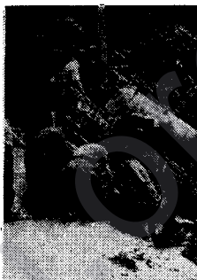
Leşkerên Ordîya Çardegemînê di Burmayê de. Herwekî baranê xurt dibarin, pêşveçûna tîgan zehmet e. Lê mirovên heja her tiştî pêk tînin. Tangek ji rê ketî, lête derêxistin.