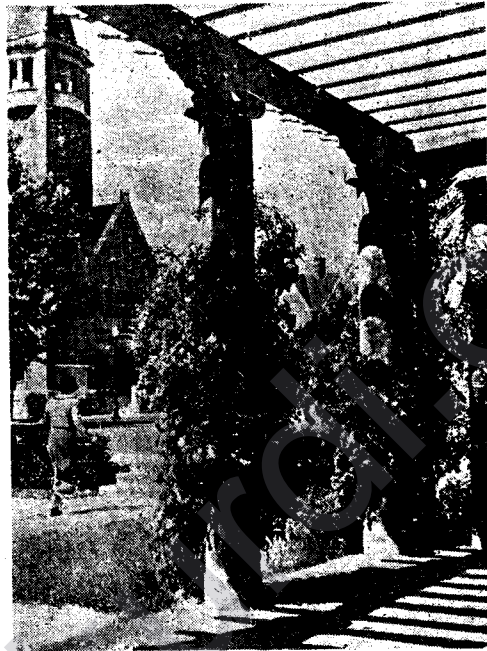
Ji BERGEHÊN BAJAREKÎ ÇELENG