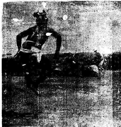
Reşîk Dîreqîsîn, Kêfa Her Miletî Bû Awakî Dîn Tê.