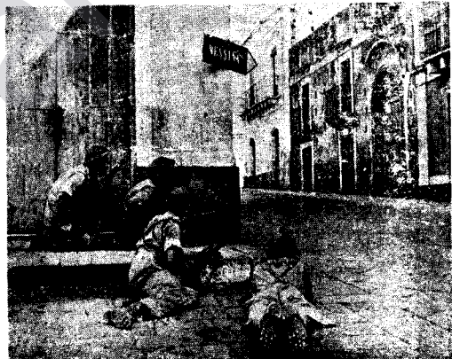
Eniya Talyanî: Ceng Di nav Kûçe û Kolanan De Dom Dike.