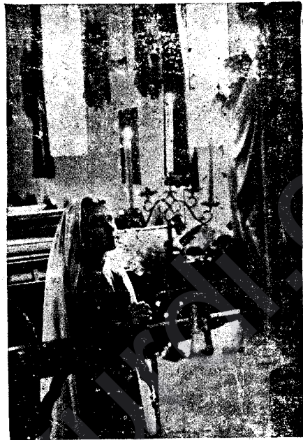
Keça General DE GOL Ji Bona Azahî û Serbestiya Welatê Xwe Dia Dike.