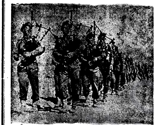
Leşkerên Ordîya Britanî A Heştan Dikevin Mesînayê. Ev Eskerên He Skoç In û Mîna Kurdan Ji Dahol û Zirnê Hezî Dikin.