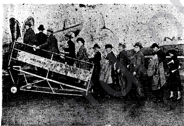
Balsfireke Emerîkanî a Rêwîngîyan; Bajar û Şarîstanên Emerîkayê Ne Bi Tenê Bi Rê û Rêhesînên Çak Lê Bi Rîyên Hewayî Jî Pev Re Girêdayî Ne.

Di nav mîletên dinyayê ên mezintir de yê ciwantir mîletê emerîkayê ye.