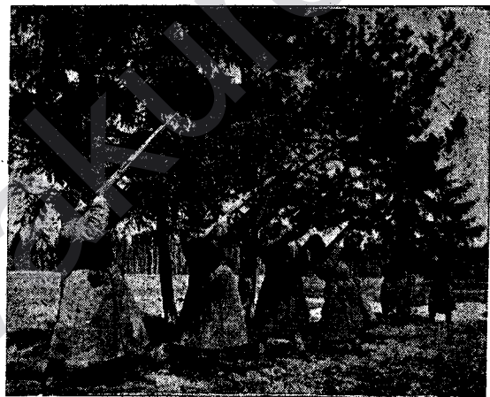
Peyadeyên Ordîya Sor Balafireke Dijmin Didin Ber Derbên Tîfingên xwe.