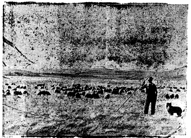
Qey Bergehek Ji Welatê Me ê Delal Kurdîstanê: Şivan, Seh û Pezên Di Wî.

Wexta berî da kes ne dizanî bû ko di piştî behran de erdine mezin hene. Peyayekî hiyyar û şeh-reza Krîstof Kolomb sala 1492-an de erdê Emerîkayê keşîf kir. Ji İngîlistanê û ji welatên din zehf peyayên heja û serbest, yên ko jî zîlm û l'adayên axa, beg û mîran bi gotinekê jî zorkerîya mezinan aciz bûbûn, dev ji mal û welatê xwe berdane û hatine Emerîkayê, tede gund û bajar avakirine, bi zanîn û hêjabûna xwe, ji kaniyên Emerîkayê ên tîrdewlemendî istî-fade kirine, pêş ve ketine. Xelk hemî hînfî xwendin û nivîsandîne