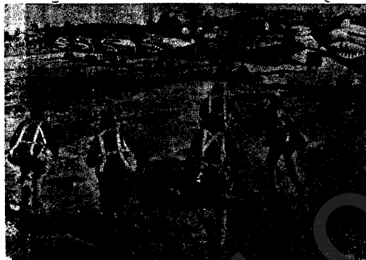
Ji Wêneyên Eniya Şerê Pasifikê, Ji Bona Balafirvana Dema Êrîşê Hatiye.