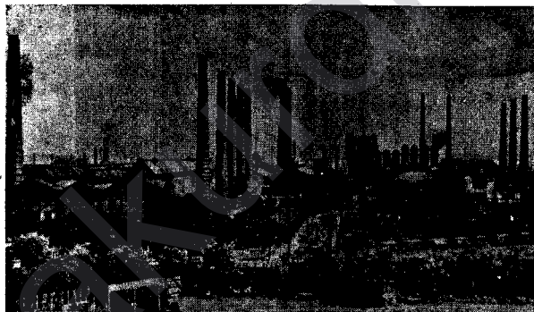
Ji bergehên axa Çekoslovakayê, kaxxane û febrîqeyên Pragê ên mezin.