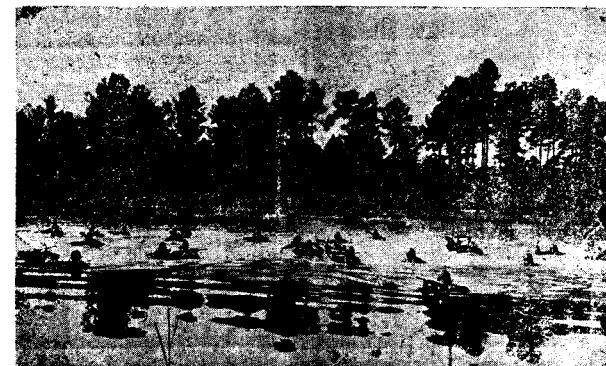
Di Eniya Pasifikê De Zora Japona Diçe; Eskerên Hevalbenda Berê Xwe Dane Japona Li Awekê Derbaz Dibin.