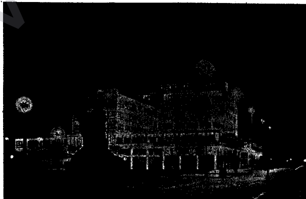
Ji Wêneyên Payetextê Çekoslovakayê, Gerinendekariya Elektrîkxana Pragê