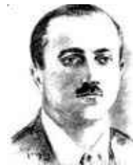
Osman Sebrî 1905 - 1993

Xebat ji bo : * Zordarî ji ser gelê me yê Kurd li Sûriyê rabe . * Azadiya demokrat û rêzgirtina mafên mirovan . * Mafên gelê Kurd yên netewî di çarçewa yekîtiya welêt de .