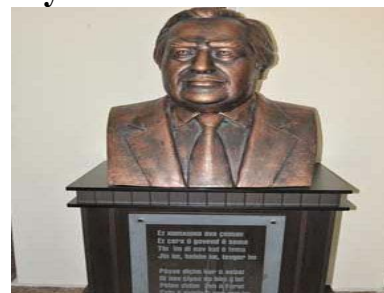
Ev herdu nûçe ji Rojname Agirî H. 162 hatine girtin

Piştî axaftinan, peykerê Cegerxwîn hate vekirin. Diyarname