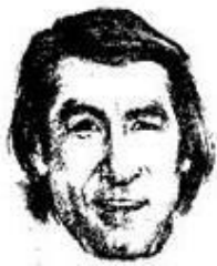
Dr Nûredîn Zaza 1919- 1988