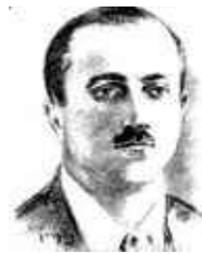
Osman Sebrî 1905 - 1993

Ji weşanên Partiya Yekîtiya Demokrat a Kurd li Sûriyê - YEKÎTÎ