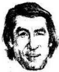
Dr Nûredîn Zaza 1919- 1988