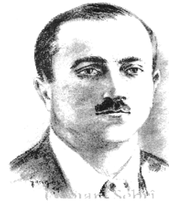
Osman Sebrî 1905 - 1993

Xebat ji bo : * Zordarî ji ser gelê me yê Kurd li Sûriyê rabe. * Azadiya demokrat û rêzgirtina mafên mirovan. * Mafên gelê Kurd yên netewî di çarçewa yekîtiya welêt de .