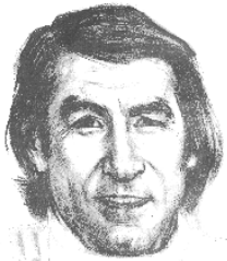
Dr Nûredîn Zaza 1919 - 1988