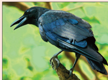
karga: qijike (m), qela (m), qirawile (m), qerpelase (m)

Not: Nameyê makî (bi tirkî: dişil) bi (m), nameyê nêrî (bi tirkî: eril) bi (n) îşaret biyê.