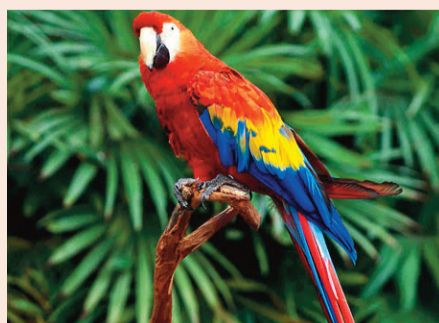
papağan: tûtî, -ye; papaxan, -e