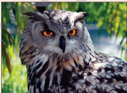
baykuş: kund (n), bum (n), puyo kor (n)