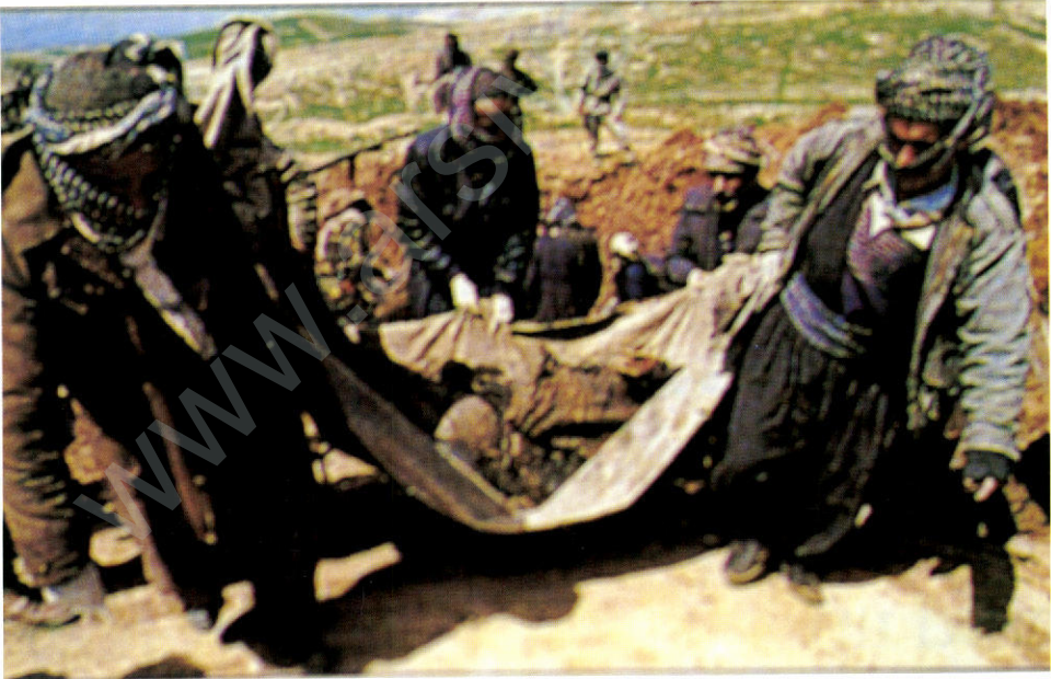
'Total destruction': A mass grave in Sulaimaniya where Iraqis buried entire Kurdish families.