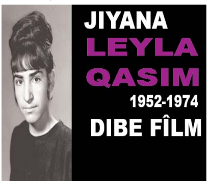
JİYANA LEYLA QASIM 1952-1974 DIBE FİLM

darizandinê de ji dadger re wiha dibêje: "Min bikujin lê vê rastiye jî bizanin ku bi kuştina min dê bi hezaran Kurd şiyar bibin. Min ji bo azadiya Kurdistanê canê xwe feda kir, ez ji vê serbilindim." Her wiha dema çû ser sêdarê jî sirûda 'Ey Reqîb' xwend.(ANF)