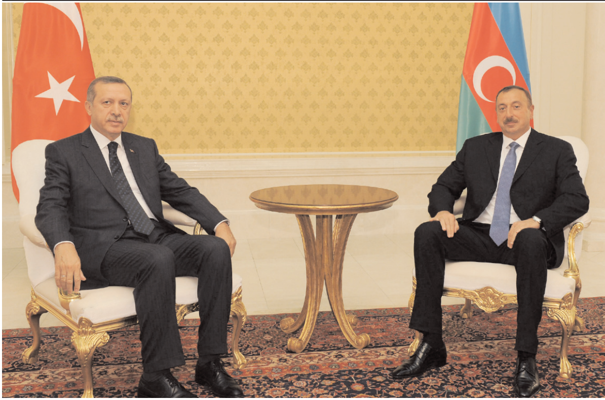
İlham Əliyevin və Türkiyənin Baş naziri Rəcəb Tayyib Ərdoğanın təkbətək görüşü olmuşdur