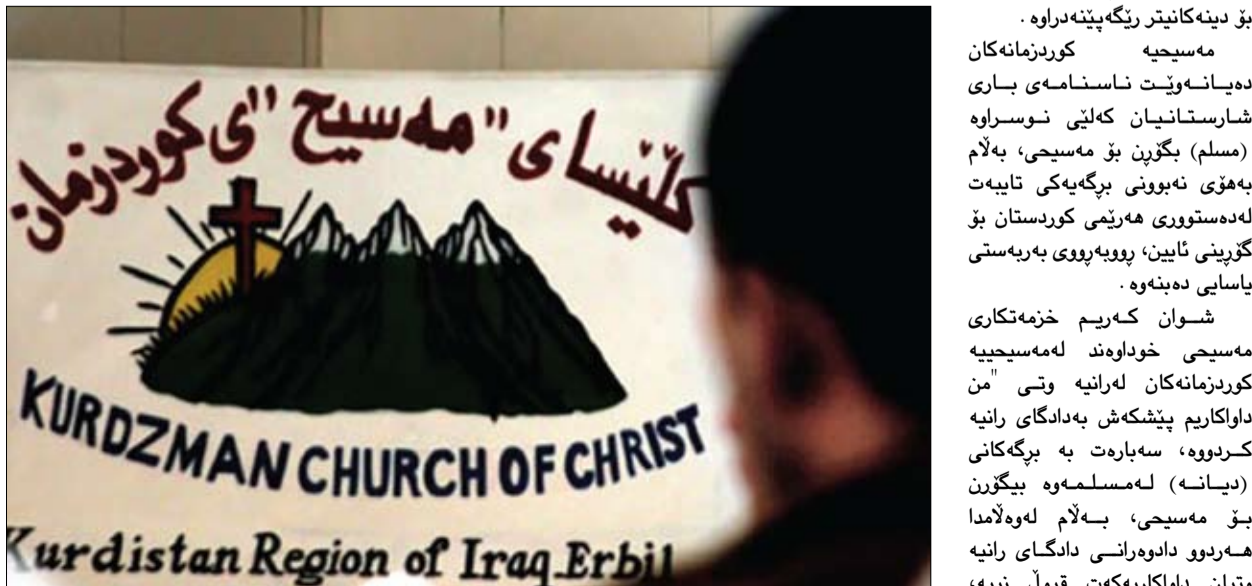
لەناو دەزگاکاندا ھیشتا مەسیحیە کوردزمانەکان موسڵمانن.