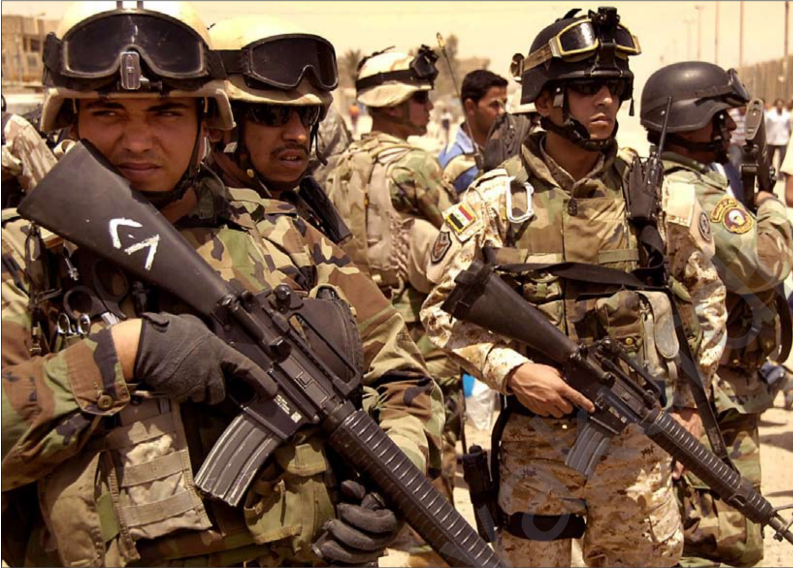
چەند سەربازێكى سوپای عێراق

دەستور: ۷۹ ساڵ بەسەر سوپای عێراقدا تێدەپەرێت، ئیستا هەولەكانى بنیاتنانەوهى ئەو سوپایە لە چ ئاستێكدا یە؟ سەرئێپ كاكەیی: لەدوای ۲۰۰۳ هەموو دەزگاکانى عێراق هەلۆهشایەوه، یەكێك لەو دەزگایانەش سوپای عێراق بوو، دواتر ئەو سوپایە كە بنیاتنرایەوه بەپێى مادەى دەستورێى بوو، هەرچەندە كەموكۆرى تێدا یە، چونكە مادەى نۆى دەستور بەروونی ئامازە بەوه دەدات سوپای عێراق دەزگا ئەمنییەكان لەپێكها تەكانى عێراق پێكێنن دەبێت نوێنەرایەتى سەرچەم خەلكى عێراقى تێدا بێت بەبێ جیاكردنەوهو دوورخستنەوهى هیچ پێكها تەك، هەرۆه سەرکردایەتى ئەو سوپایەش سەرکردەیهكى مەدەنى بێت، ئیشى سوپاكەش پارێزگارى لەگەلى عێراق بكاتو نەبێتە دەزگایەكى سەرکوتەرو دەست لەكاروبارى سیاسى وەرئەدات، هیچ دەورێكىشى لەگۆرانكارى دەسەلاتدا نەبێت، ئەمانە بنەمای زۆر گشتین بۆ پێكها تەى سوپای ئیستای عێراق، ئەم سوپایەى ئیستا زۆر جیاوازتر دەبێت لەو سوپایەى رێژیمەكانى پێشتر، چونكە پێشتر سوپای عێراق هیچ كاتێك سەرکردەكهى سەرکردەیهكى مەدەنى نەبوو و كارو ئەرکەكانى ئەو نەبوو كە نەبێتە سەرکوتەركێك بۆ گەلانى عێراق، چونكە گەلانى عێراق و گەلى كوردستان ئازارى زۆرى بە دەست ئەو سوپایەوه چەشتوو، دەسەلاتى عێراق بەشێوهیهكى تاكەرپوانە بەرپۆهبراو، ئەو سوپایەش بەو شێوهیه نەبوو كە هەموو پێكها تەكانى عێراق رۆلێان تێدا هەبوو بێتو دورنەخرابنەوه.