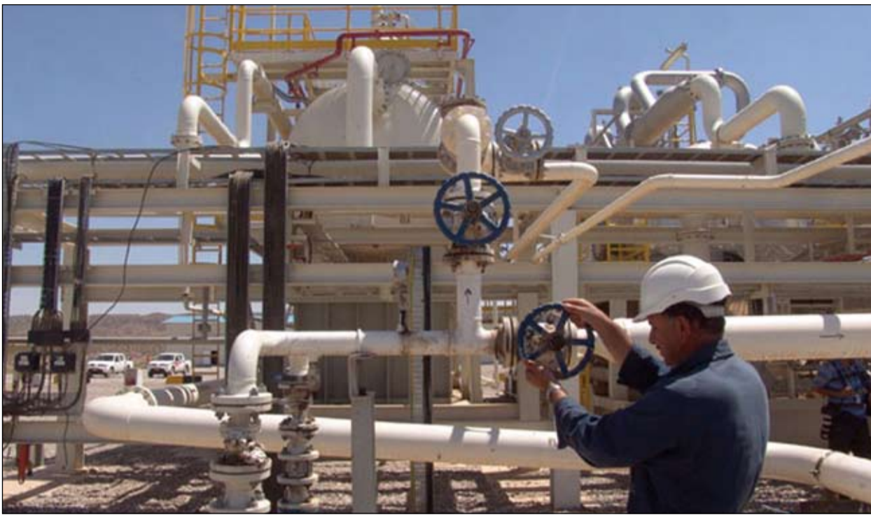
حکومت کیشی دابینکردنی سووتهمه‌نی چاره‌سهرنه‌کردوه