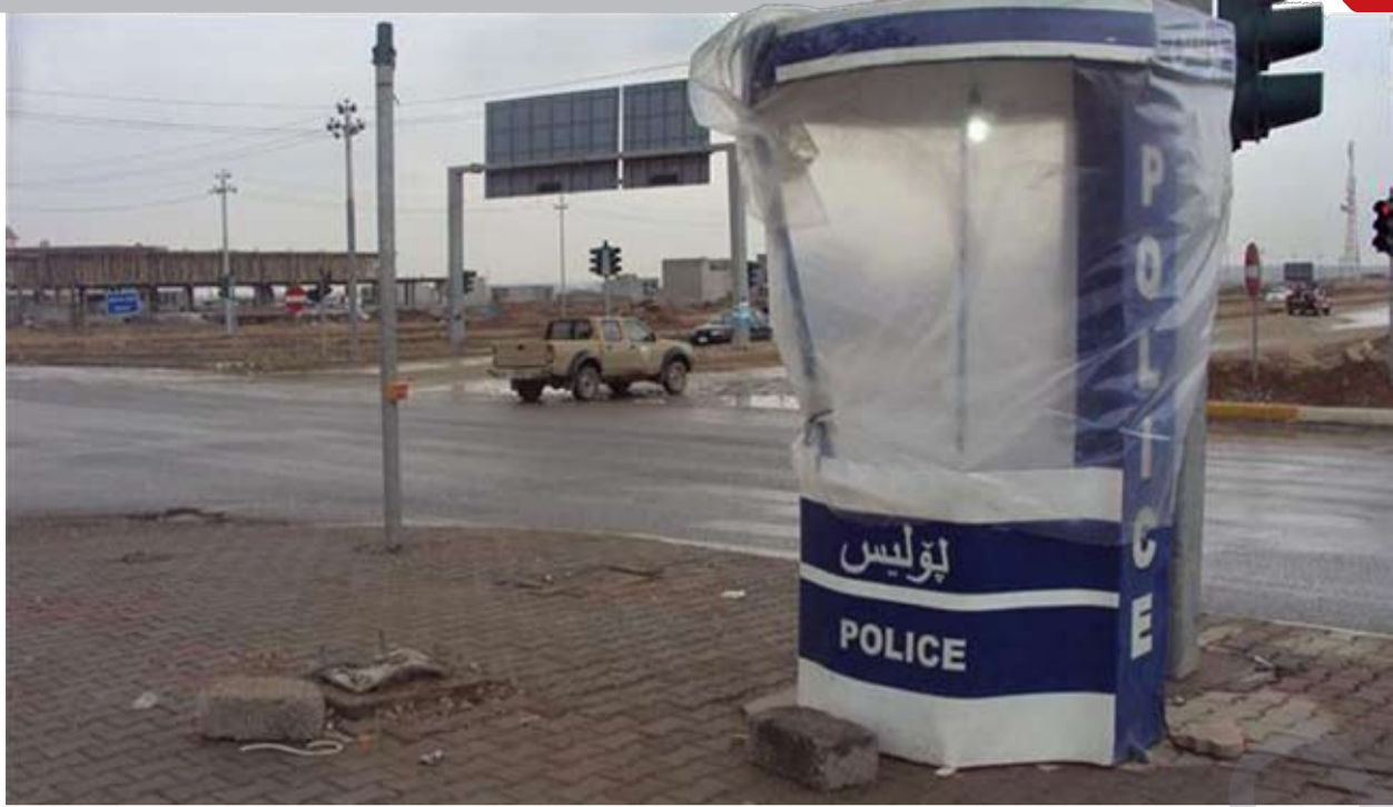
پۆلیسەکانی هاتوچۆ سەرمايەنە.

رێپێدرار ئاماژەی بەوەدا کە ئەگەر کار بە نەبێت، نابێت کارمەندی هاتوچۆ لەناو کابینەیکە دانیشیت، چونکە کارەباکەمان جیگیر نییە. ئەو کارمەندانە داوادمەکان ئاوریان لێدێرتووە لەلایەن بەرپێوەرایەتی هاتوچۆی، کێشەیی کابینەکان چارەسەر بکړیتو مەترسیەکانیان لەسەرکەمبیتووە.