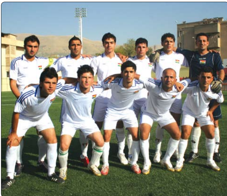
تیبی تۆپى پیتی یانهی شیروانه . فۆتوگراف: ئارام محممه

كی له ئاژاوه كانی یاریگای ههولیر بهرپرسه؟