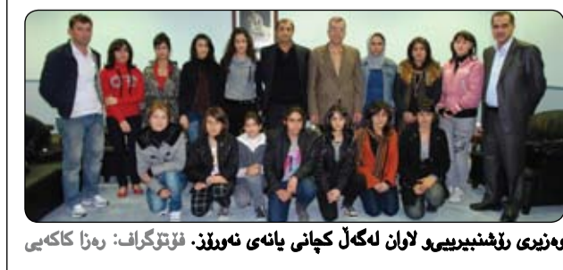
وهزیری رۆشن بیری و لوان له گه ل كچانی یانه ی نه ورۆز .

ئهرکی راهینه رابه تی لیسه نداریه وه . له مباره یه وه سه لآخ عه لی سه ره رشتیاری تیپی تۆپی پی یانه ی زاخو تایبته به ده ستور سپۆرت وتی "هۆكاری سه ره کی دۆپانی یه كه می یانه كه مان بهرامبهر یانه ی ههولیر بۆ راهینه ره ده گه ر پته وه، بۆیه بریارماندا پۆسته كه ی لیوه ر بگرینه وه". ناوبراو وتیشی له گه ل نه وه ی پیکهاته یه کی به هیزیان بۆ راهینه ره ئاماده كر دیوو، ههروه ها چه ندین یه كه ی مه شقو راهینانیاو بۆ یاریزانان كرده وه ته وه به تایبته له لوبیان، به لآم ئاستی راهینه ره له یه كه مین یارییدا وهك