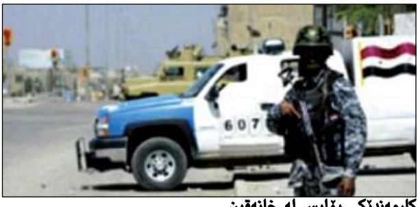
کارمه‌ندیکی پۆلیس له‌ خانه‌قین