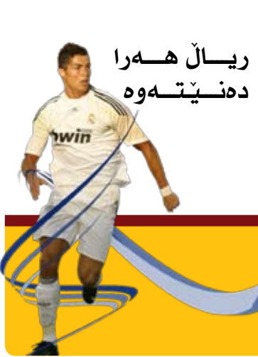
ریال ههرا دهنیتهوه