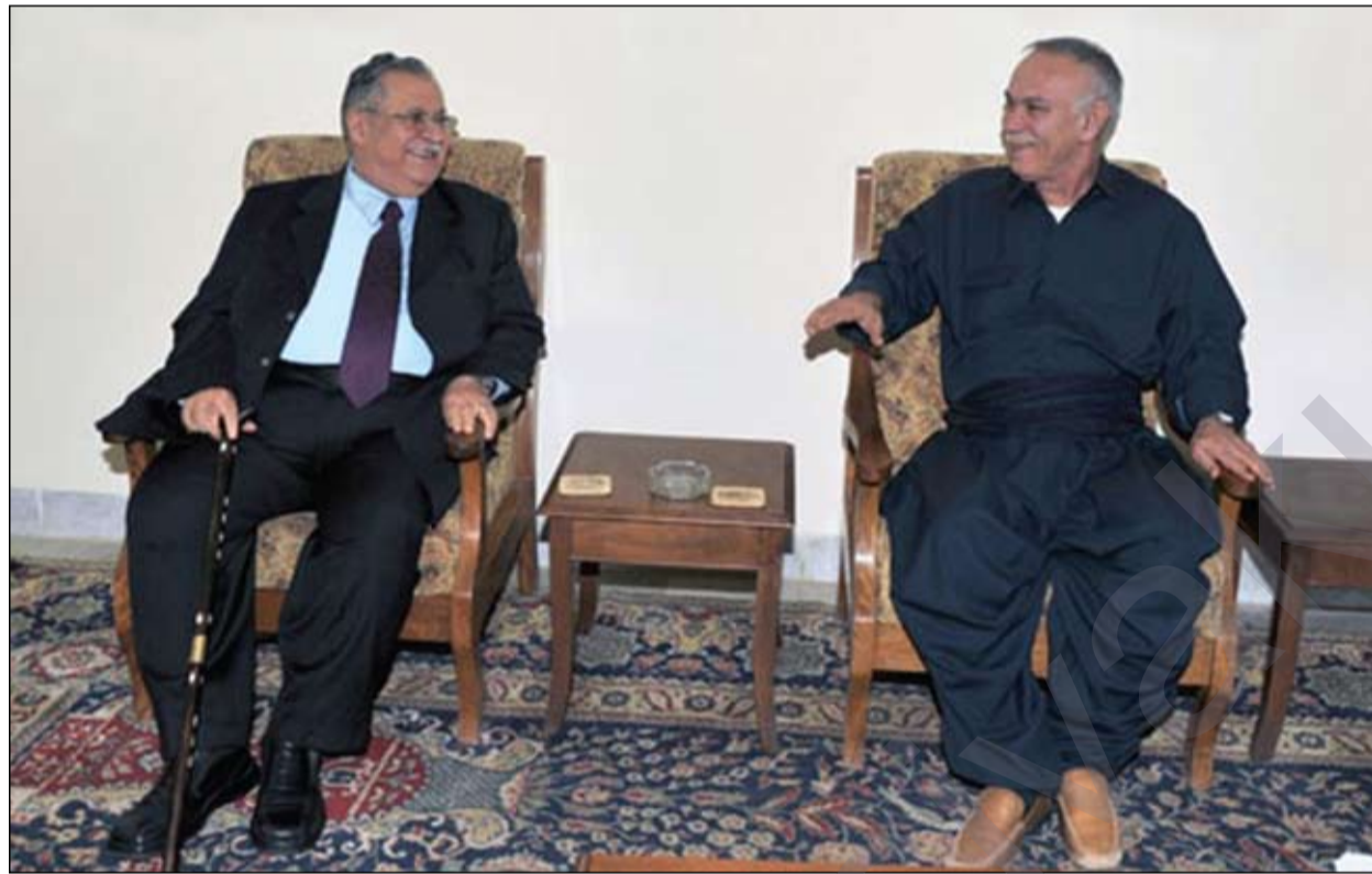
دوای (٤٠) سال هاوپیته؛ سهنگه رگرتن له یه کتراه

په یوه ندیه کی ره سمی له نیوان گۆرانو په کیتیدا، به تایبه تی له وه لومه رجه ئەمنیه دژواره ی له ماوه ی رابوردوودا بالی به سه ر سلیمانیدا کیتشابوو، مه ترسیداره .