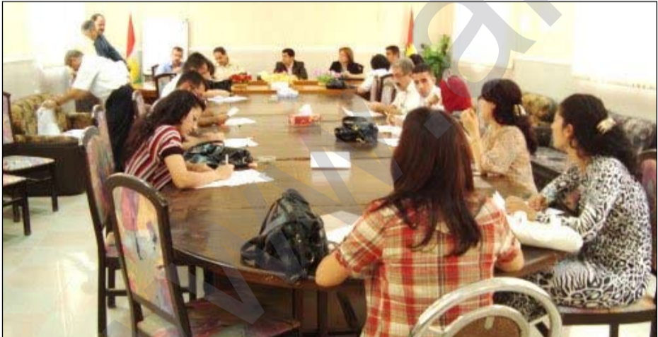
ژمارەبەک لە خۆیندکارانی کۆلیژی ئادابی خانەقین

نزیکی شەش مانگە، کۆلیژی کارگێری و ئابووری زانکۆی سلێمانی راگری نییە و سەرۆکی زانکۆش ئامازەیی بەو دەهات دانانی کەسێک بۆ ئەو پۆستە لە دەسەڵاتی ئەنجومەنی وەزیراندا. دوای ئەوەی دکتۆر ئاراس حسین داتاش راگری کۆلیژی کارگێری و ئابووری زانکۆی سلێمانی بوو ئەندامی پەرلەمانی