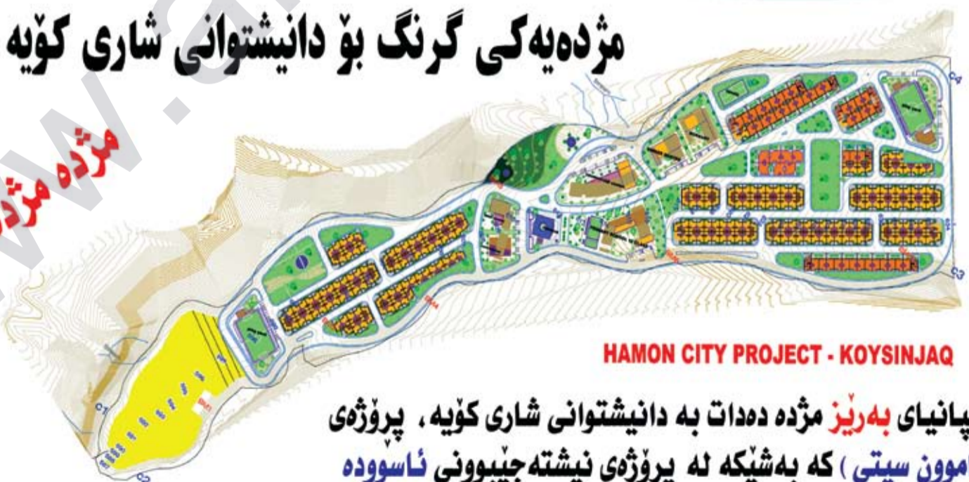
HAMON CITY PROJECT - KOYSINJAK

كۆمپانىيە بەرىز مژدە دەدات بە دانىشتوانى شارى كۆيە، پىرۆژەي (ھامون سىتى) كە بەشپكە لە پىرۆژەي نىشەتە جىبوونى ئاسوۋە