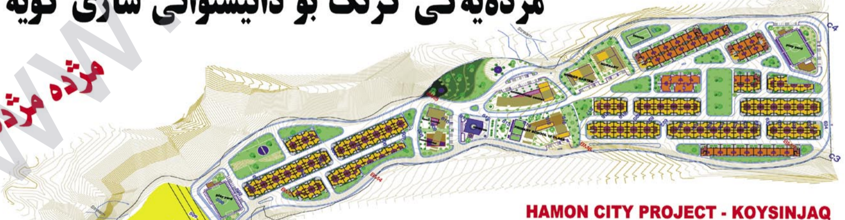
HAMON CITY PROJECT - KOYSINJAK

كۆمپانىيە بەرىز مژدە دەدات بە دانىشتوانى شارى كۆيە، پىرۋزى (ھامون سىتى) كە بەشېكە لە پىرۋزى نىشتە جىبوۋنى ئاسۋدە كەۋتە قۇناغى جىبە جىكردنەۋە، خانوۋەكانى (ھامون سىتى) لەسەر رووبەرى 150 م 200 م 2 دروست دەكرىت بە قەرزى دىرئخايەن ۋە بە ھاۋكارى سىندوقى نىشتە جىبوۋن دەدرىت بە بەشداربوۋان