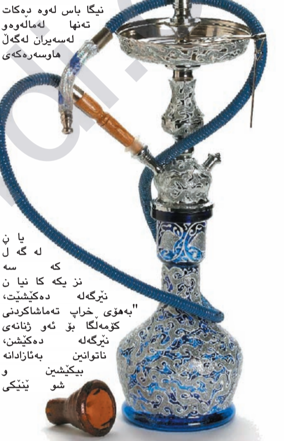
نیکا باس له وه دهکات تهنه له ماله وه له سهیران له گهل هواسه ره که ی

کچان و ژنان روو له نیرگه له کیشان دهکن و نامازه بهوه دهنده له هواسه رو که سه نژیکه کانیا نه وه فیرببون، پسپوری بوری پزیشکیش ده لین زیانه کانی کیشانی نیرگه له کیشانی جگه ره زیاتره. چندين کافترا یی تایبته به کیشانی نیرگه له کافترا یی خیزانی له شاری سلیمانی کراره نه وه، رۆژه جمعیان دیت له خیزانانه ی