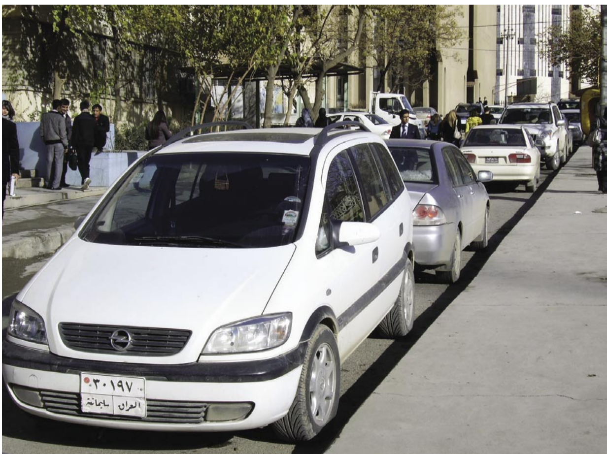
تەنها لە سالی ۲۰۰۹دا ۹۰۰ نارمى ئۆتۆمبیل لە زانكۆى سلیمانی دابەشكراوه

شارۆچكەى قەلادزى زۆر بە رۆژ لەفران بونداى و زۆرىك لە فەرمانگەکانى گواسترونتەوه بۆ دەرەوى شارۆچكە، دانیشتوانیشى لەرىگەى رۆژنامەى دەستورەوه داوادةگەن پاس بۆ هیلهکانى ناو شار دابن بکریت. مام عەلى هاوولاتیەكى شارى قەلادزییەو دەلیت بەراستى رىگای ناو شارى قەلادزى كە دەچین بۆ فەرمانگەکانى كارەباو دادگاوە خۆشخانەو پۆلیس... هەند زۆر دور، هەموو جارێك دەبێ تەكسى بگرین كە پارەيكی زۆرى دەوێت، بۆیه داواكارم لە بەرىبەرەرانى شارى قەلادزى كە هەلبەدەن پاسمان بۆ ئەم هیله بۆ دابن بکەن وەكو هیلهكانىترى ناو شار، چونكە كیشەى هاوولاتیان كەم دەكاتەوه". بەهوى دورى زۆرەى فەرمانگە حكومییهكان لەناوچەى