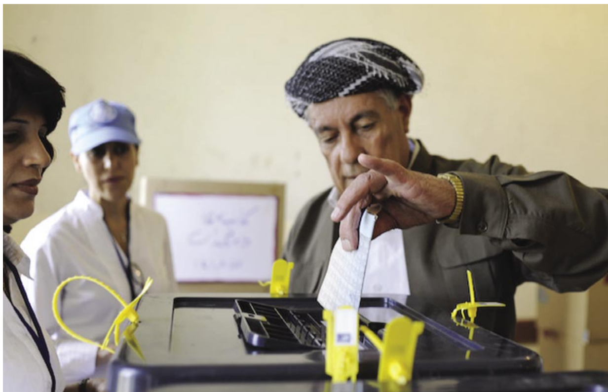
سهرکردایه تی کورد له گه ل هه لبرژاردنی ئه نجمه نی پارێزگاگاندا نییه

لیستی کوردستانی دژیته دی داوکاری لیستی ئۆپۆزیسیۆنه کانی کرد بو ئه نجامدانی هه لبرژاردنی ئه نجمه نی پارێزگاگان