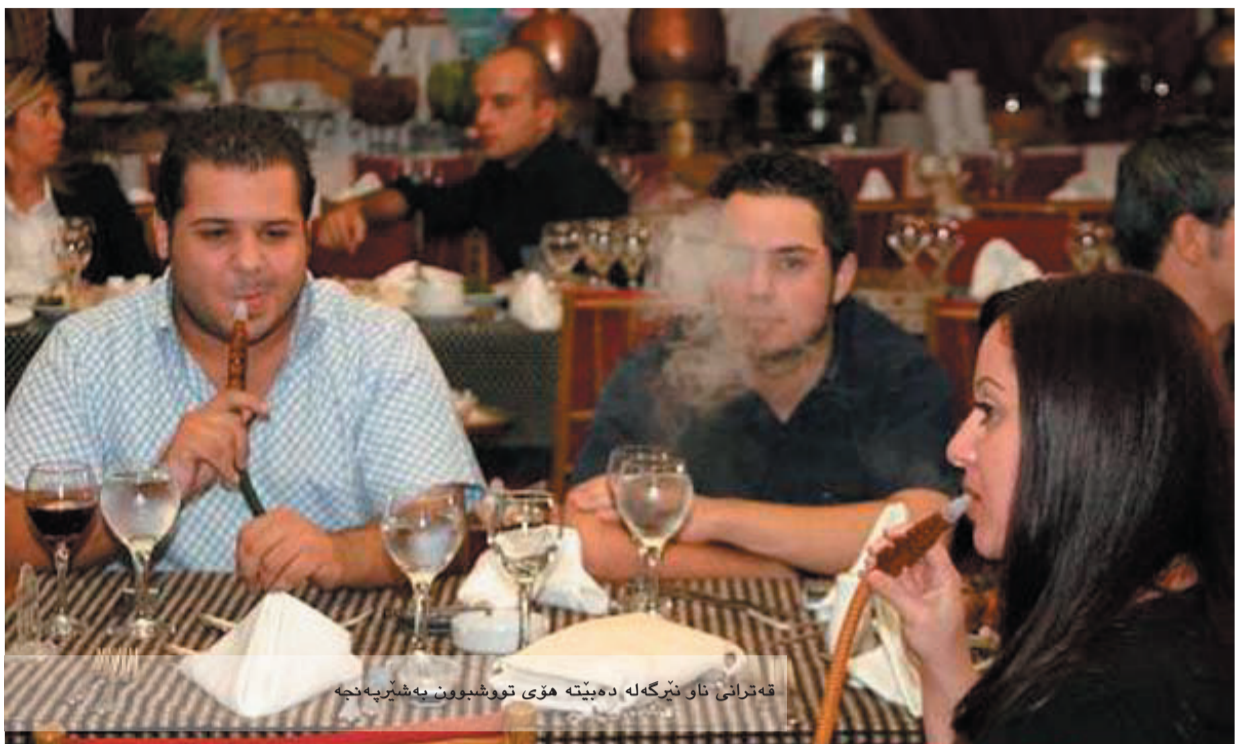
قه ترانی ناو نیرگه له ده بیته هوی تووشبون به شیربه چه

به هوی زیادبونی کافترا یا خیزانیه کان، کچان روو له نیرگه له کیشان دهکن