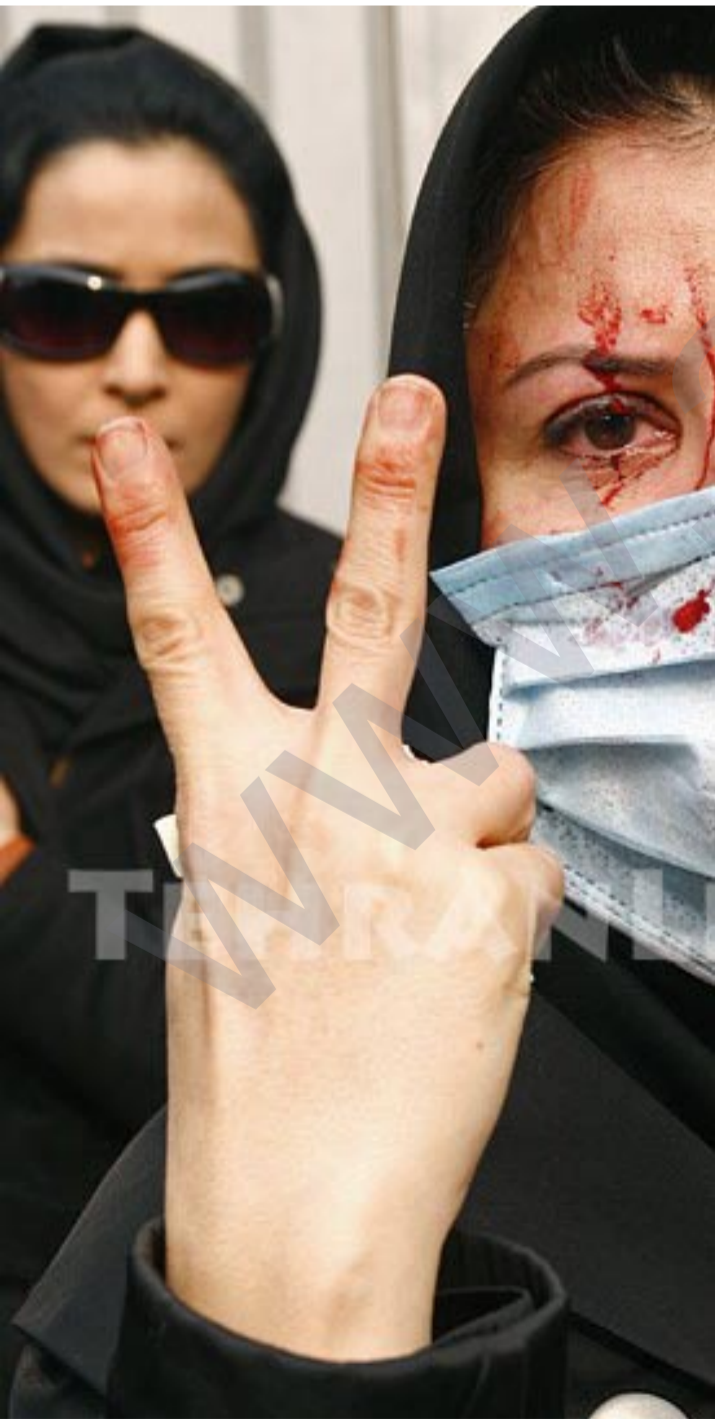
به ره نگار بوونه وه به رده وانه

خه لکی کوردستانیش، ئه و کاته ده تاونن ده سکوتی زیاتریان له داهاتووی ئهم بزوتنه وه یه هه بی که وهک هیزکی کاریگر له نیو رووداوه کاندان بو هه ولبدن شانه شانی داخوازیه گشتیه یه کان، ویستو داخوازیه کانی خو یان بینه گوزی.