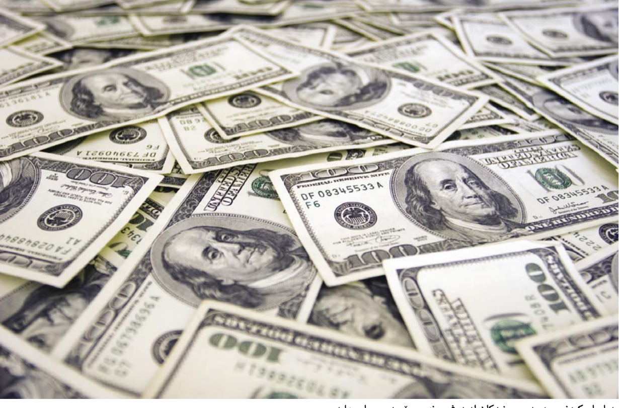
به یاساییکردنی بودجه ی حیزبه کان له به رزه وه ندی پرۆسه ی سیاسیدایه

کۆمه ل ئیسلامیش که ئیستا خاوه نی چوار کورسی په رمان خۆیان به خاوه نی پرۆژه ی یاسای حیزبه کان ده زانن، ئاماژه به وه ده کن ئه وه حیزبه که ی ئه ومان بوو که بۆ یه که مجار له خولی دوهمی په رله ماندا ئه و مه سه له یه ی له په رله ماندا ورۆژاند وه ک ژانا ئه سته یی ئه نجامی سه ر کرایه یی داوا راپۆرتی حکومه ت ده کات، بۆ هه ر کورسیه کی په رله مان مانگانه بری (۵۰-۱۰۰) ملیۆن دینار دیاریکراوه، به لای هه ر به یی یاساکه ئه وه دیاری کراوه که نایبت ئه و بودجه یه که بۆ حیزبو قه واره سیاسییه کان ته رخاندن ده کرت بگانه (۲٪) بودجه ی گشتی ولات. له خولی دوومی په رله ماندا به یاساییکردنی بودجه ی حیزبه کان له به رزه وه ندی پرۆسه ی سیاسیدایه