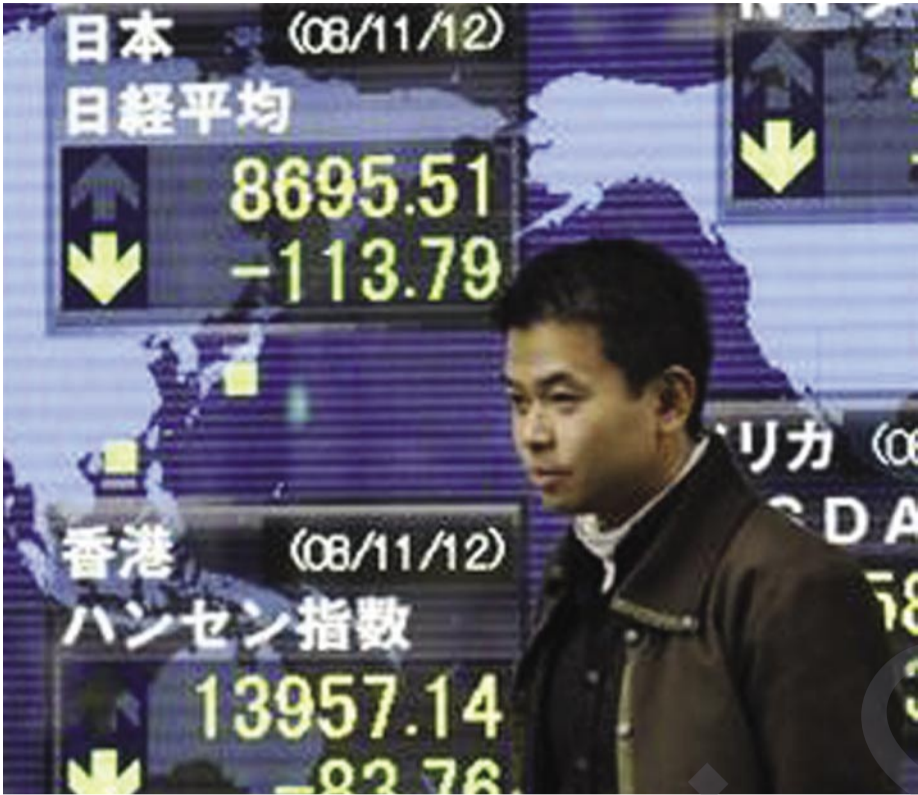
قهیرانی ئابوری ناسنامه یه کی تری ده یه ی یه که م

رۆژی ۹ حوزهرانی ۲۰۰۵، ههلسورویکی کورد به ناوی شوان قه دری له لایه ن هیزه ئه منیه کان ی ئێران وه به شیه یه کی دیندانه