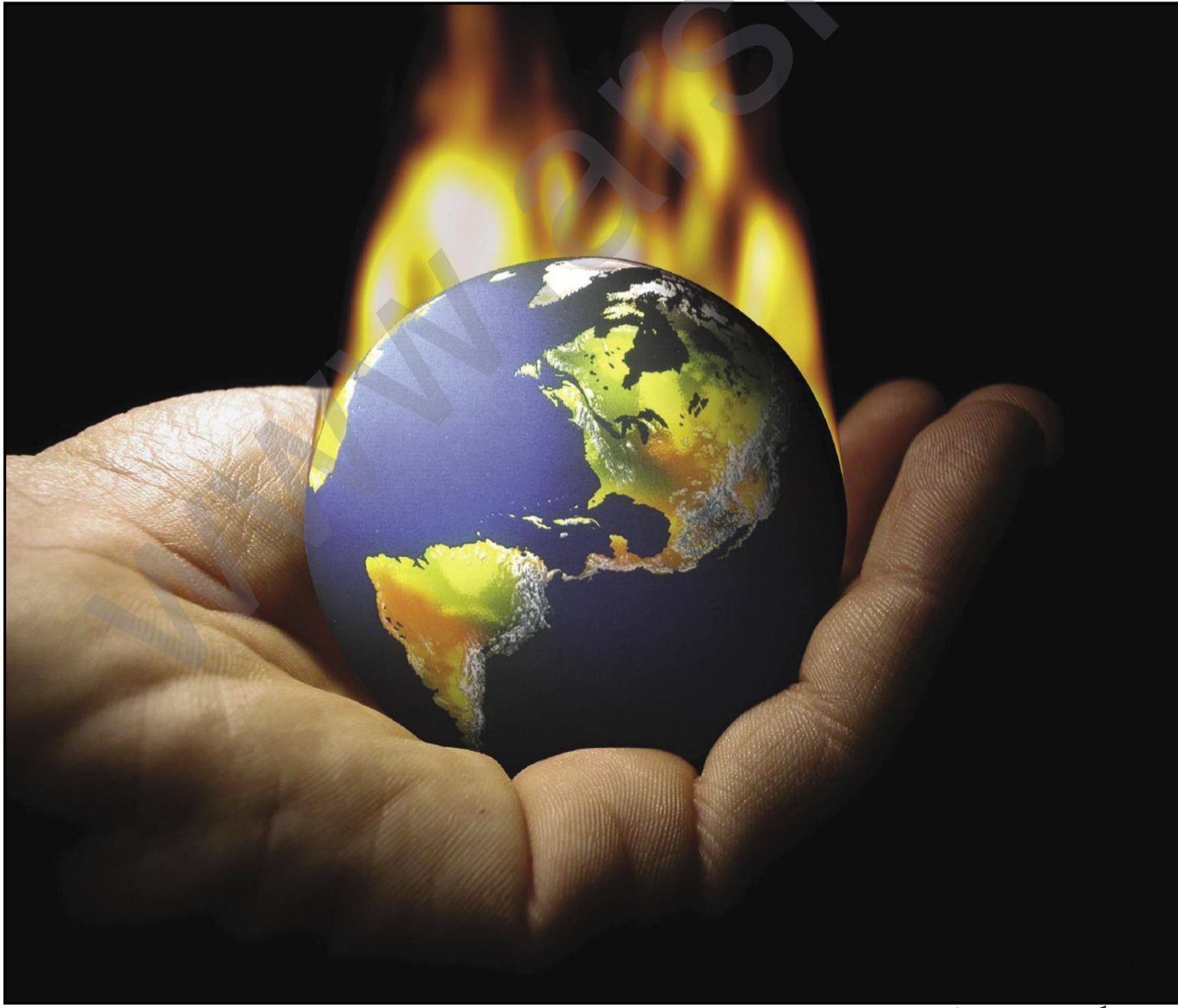
گه رمبونی گۆی زه ی هه ره شه یه کی تره

ویرای رو داوه سیاسییه کان و جهنگه کان، له ده ی یه که می هه زاری سێیه م دا، چه ندین په تایی جیهانی بلاویوه وه، که دیارترینیان سارس و ئه نفۆنزای په له وه رو به رازه. هاوکات گۆرانکارییه کان که شه وه وا به یه کێک له گه وره ترین مه ترسییه کان بۆ سه ر گۆی زه ی داده نریت و به گۆریه ی نه ته وه یه کگرتووه کان، له م ده یه دا به رترین پله ی گه رما تۆمارکراوه له چا و سالانی رابردو. هه ره ها به هۆی کاره ساته سروشتیه کان ی وه کو لافا و بومه له زه وه هه زاران که سه گیانیان له ده ستدا زیانه کانیان به سه دان ملیۆن دۆلاره خه ملینریت.