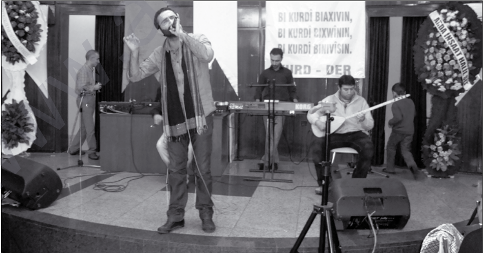
Hunermendên Koma Xelikan Ergin.

BDP, Hak-PAR, KADEP, SES, 78LİLER GİRİŞİMİ, EĞİTİM SEN, İHD, YAPI YOL SEN, Bi nûnerên xwe beşdarî şevê bûn.