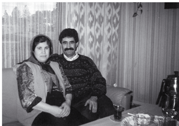
Fatê xanim û dergistiyê xwe Hes

rin. Piştî havînê zaxîra xwe helnan, wan ji bo ku qelindê keçikan nedin, em kirin berdêl. Malbata dergîstî min zêr û bajara keçika xwe kirin, bavê min jî zêr û bajarê min kir. Hertîşt tamam e, em î li benda birangê min in ku ji eskerê were û em dawetê bikin.