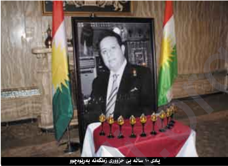
یادی ١٠ ساله‌ی حزووری زه‌نگه‌نه‌ به‌رێوه‌چوو

هه‌روه‌ها هه‌ر له‌و چله‌یه‌دا ١٠٠ هونه‌رمه‌ندی هه‌ر چوار پارچه‌که‌ی کوردستان دینه‌ سه‌ر شانۆ.