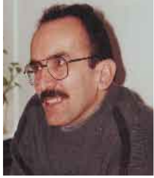
حاجی مه مو