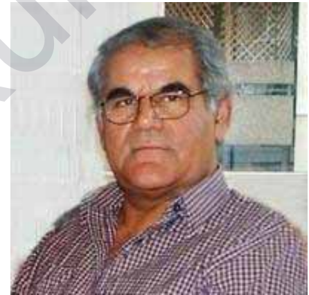
Îranê Nûneratiya Derveyî Welat Parîs 29.12.2009