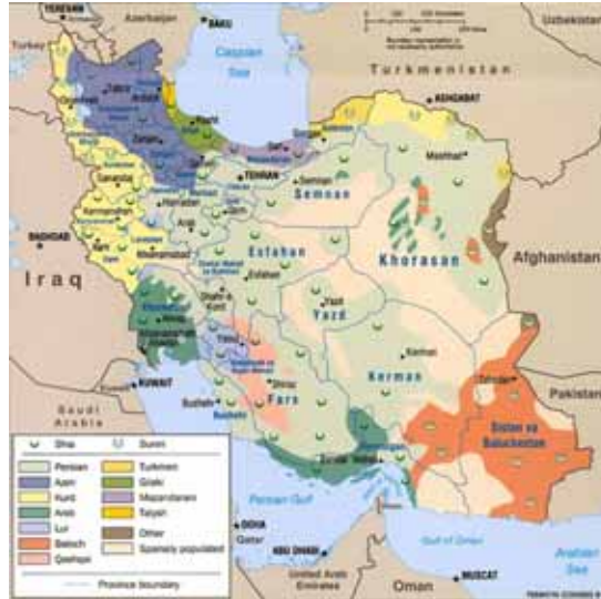
PDK Îranê xwe bi hevalbendê neteweyên Îranê dizane

Di heyamê şerê duyem ê cîhanî de û piştî jinavçûna dîktatoriya Riza Xan, derfeteke baş di herêma de hate holê ku avabûna hinek partiyan di seranserê welat de jê ket. Di sala 1324(1945)an de, piştî damezrandina partiye û ragihandina bernameya wê ku ji 8 xalan pêk hatibû, di du xalên vê bernameyê de qala demokrasî û hevalbendiyê tê kirin, PDK Îranê jî vê rewş û zirûfê mifahê distîne û dest davêje avakirina Komara Kurdistanê, PDK Îranê her ji destpêkê de digihîje vê rastiyê ku bi bê hebûna hevalbendiyeye demokrat û bihêz, parastina wan destkevtan ne hêsan