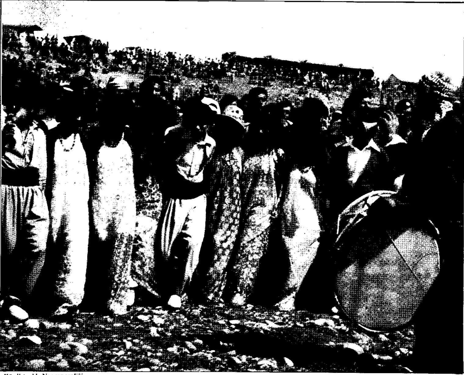
Kürdistan'da Newroz şenliği